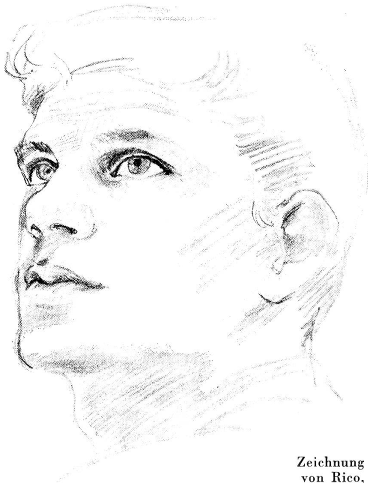
Zeichnung von Rico, Zürich