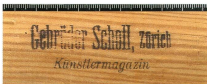
Abb. 5 | Im Garten , 1911, Ölfarbe auf Gewebe, 98 x 91 cm, Kunstmuseum Solothurn, Dauerleihgabe der Moos-Flury-Stiftung, Biberist (Kat. 1911.08); Rückseite mit Detail des Keilrahmens und Firmenstempel: «Gebrüder Scholl, Zürich / Künstlermagazin», in der üblichen schwarzen Tinte.