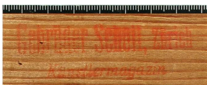
Abb. 6 | Porträt Giacometti , 1910, Ölfarbe auf Gewebe, 61 x 56 cm, Privatbesitz (Kat. 1910.21), vgl. Abb. 170; Rückseite mit Detail des Keilrahmens und Firmenstempel: «Gebrüder Scholl, Zürich / Künstlermagazin», in einer unüblichen roten Tinte.