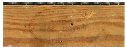
Abb. 3 | Selbstbildnis mit Gattin , 1899, Tempera auf Gewebe, 76 x 52 cm, Collezione città di Lugano (Kat. 1899.01), vgl. Abb. 136, Rückseite mit Detail des Keilrahmens und Firmenstempel: «[...] / Schreibmaterialien / Jos. Bayerle / München / 11 Akademiestrasse 11».