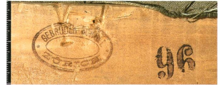
Abb. 7 | Akt , 1913, Ölfarbe auf Gewebe, 97 × 90,5 cm, Privatbesitz (Kat. 1913.35), vgl. Abb. 67; Rückseite mit Detail des Keilrahmens und Firmenstempel: «GEBRÜDER SCHOLL / ZÜRICH», rechts davon Massstempel «96».

«Hast Du die neuen Holländischen Farben versucht? Ob sie auch wirklich zuverlässig sind? Letzthin hat eine neue Fabrik in Paris auch neue zuverlässige Farben anempfohlen. Es wäre doch herrlich wenn man sich auf sein Material verlassen könnte», schrieb Giovanni Giacometti im Januar 1909 an Cuno Amiet. 27 Dieselbe Mischung aus Misstrauen und Neugier brachten viele Zeitgenossen den neuen Malfarben entgegen, die in diesem relativ frühen Zeitalter der industriellen Farbenherstellung in grosser Zahl auf den Markt drängten. Amiet selbst legte Wert auf gute Haltbarkeit. 28 Bei aller Vorsicht scheint er aber in der Regel nicht lange gezögert zu haben, neue Produkte wenigstens zu testen; eine Haltung, mit der er keineswegs allein war. Die Raffaëlli -Ölfarbenstifte zum Beispiel, die im Herbst 1902 lanciert worden waren, und die Amiet schon in der ersten Jahreshälfte von 1903 verwendete, fanden schnell auch bei vielen seiner Schweizer Malerkollegen Anklang (Abb. 8). 29 Auf den Asbestzementplatten der Marke Eternit , die erst im Vorjahr in der Schweiz erhältlich geworden waren, malten bereits im Herbst 1904 nicht nur Amiet, sondern auch Giacometti und andere Zeitgenossen. 30 Eine kleine Sensation im Rahmen unserer Untersuchungen war die Entdeckung, dass Amiet schon 1910