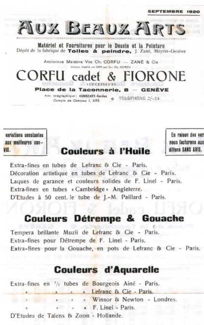
Abb. 1 | Zwei Details einer Preisliste des Genfer Geschäfts für Künstlerbedarf Aux Beaux-Arts vom September 1920 mit der Nennung von Malfarben verschiedener Hersteller in Frankreich (Lefranc & Cie, F. Linel, J.-M. Paillard, Bourgeois Ainé), England (Winsor & Newton) und den Niederlanden (Talens & Zoon) aus dem Nachlass von Abraham Hermanjat, Fondation Abraham Hermanjat, Nyon, Archiv.

Der grossen Zahl der Händler entsprach die Breite des Angebots. Werkzeuge, Bildträger und diverse andere Artikel wurden, wenn auch nicht immer vom Händler selbst, so doch häufig vor Ort angefertigt. Firnisse, Malmittel und Tubenfarben hingegen wurden – mit nur einer einzigen bisher bekannten Ausnahme 6 – aus dem Ausland importiert (Abb. 1 und 2). Die Nachfrage bestimmte das Angebot: So liess sich der Luzerner Farbenhändler Fuchs beispielsweise 1870 von Rudolf Koller dazu überreden, Farben und andere Artikel der Marke Regnier aus Paris zu importieren.