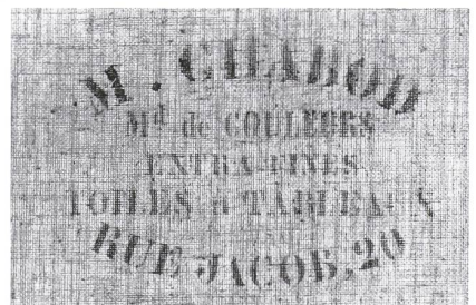
Abb. 4 | Bei Hellsau , 1891, Malfarbe auf Gewebe, 27,5 x 41 cm, Privatbesitz (Kat. 1891.24), Rückseite mit einem Detail des Bildträgergewebes und Firmenstempel: «M. CHABOD / M[archan]d de COULEURS / EXTRA FINES / TOILES à TABLEAUX / RUE JACOB, 20».