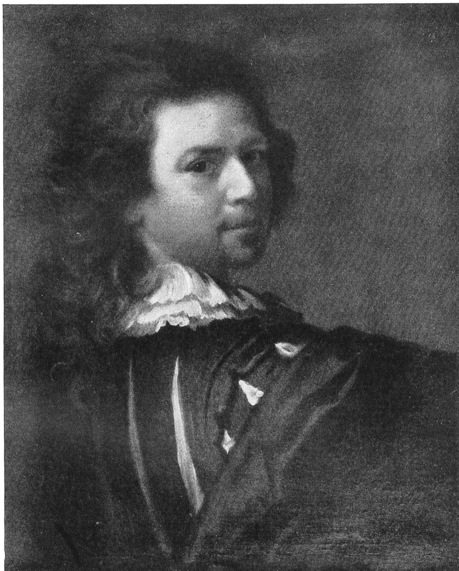
Portrait d'Alexis Grimou peint par lui-même, 1724