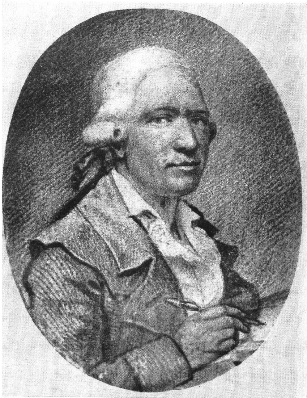
BENJAMIN BOLOMEY (1739—1819)