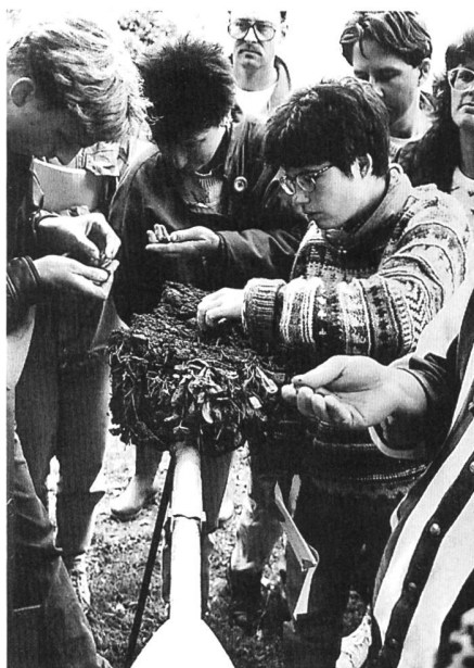
Kursteilnehmer beim Beurteilen einer Spatenprobe