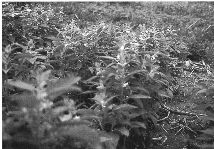
Sesam in der Blüte, gesuchtes Alternativprodukt

PS: In einem zweiten Beitrag wird H.J. Rinklin auf die entwicklungspolitische Dimension und auf die agrarpolitische Realität eingehen.