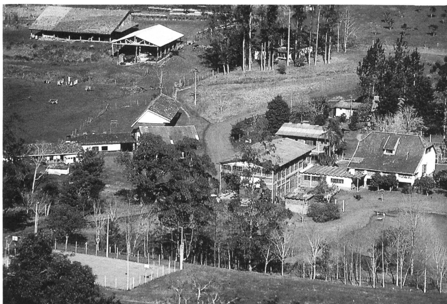
Die Schule für junge Bauern

Terra Nova ist eine Gemeinschaft von Christen verschiedener Konfessionen. Ausländer und Einheimische versuchen gemeinsam, Mission und Entwicklungshilfe zu leben. Wir wollen den Nöten der Menschen in ihrer materiellen, seelischen und geistlichen Dimension begegnen, mit ihnen das Leben teilen. Aus diesem Leben erwachsen verschiedene Arbeitszweige. So ein Mädcheninternat, das den Töchtern aus abgelegenen Gegenden des Landkreises den Schulbesuch der 5.–8. Klasse ermöglicht. Später entstand dann ein 2jähriger Ausbildungszug für die männliche Landjugend. Er ermöglicht den Jungens, die 5.–8. Klasse nachzuholen und daneben in Landwirtschaft und ökologischem Landbau ausgebildet zu werden. Daneben gibt es eine Spielstube zur Förderung von Kindern im Kindergartenalter, eine Frauenarbeit und auch einen landwirtschaftlichen Produktionsbetrieb, der seit 6 Jahren ökologisch be-