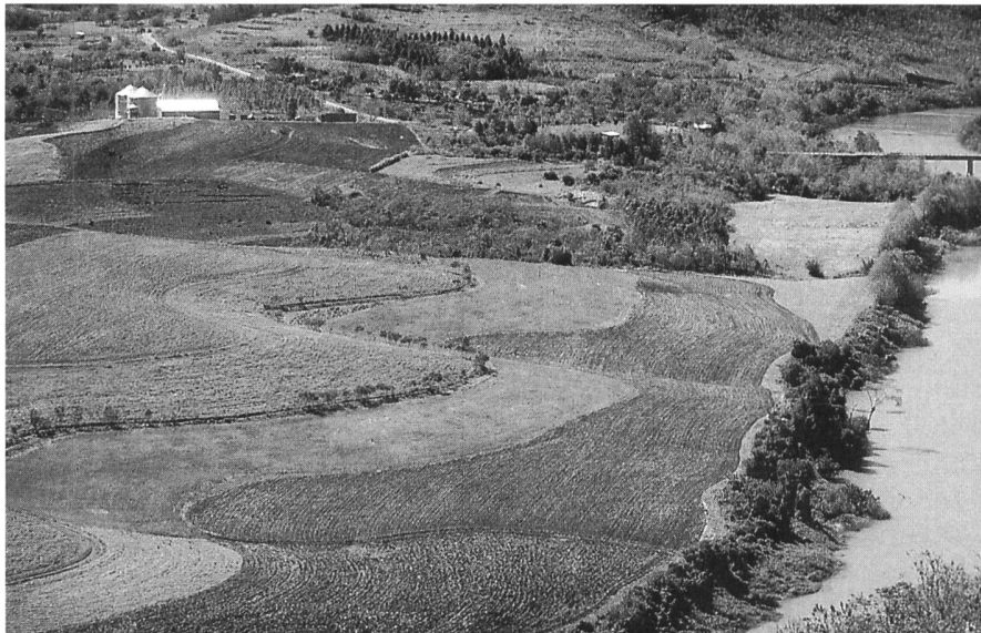
Unsere Anbauflächen werden seit 6 Jahren biologisch bewirtschaftet

Neben dem feldmässigen Anbau auf etwa 30 ha haben wir auch ein kleines Versuchsfeld angelegt. Wir wollen an der Verbesserung der organisch-biologischen Methoden in unserer Klimaregion arbeiten und neue Kulturen ausprobieren. Obwohl wir einen kurzen Winter mit leichten Frösten haben, neigt das Klima