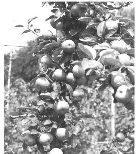
Die Wahl der richtigen Sorte hat im Bio-landbau erste Priorität.

Seit rund 10 Jahren sind die ersten schorfresistenten Sorten bei uns im Anbau. Auf