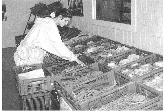
Gute Qualität findet immer ihre Käuferin.

Kultur und Politik: Während Jahrzehnten hatte die AVG eine Art Monopolstellung im Biohandel. Das ist heute nicht mehr so. Die Produzenten finden andere Abnehmer, ich denke da z.B. an Via Verde, Eichberg, SGG oder Terra Viva sowie an den konventionellen Handel, der mehr und mehr in das Biogeschäft einsteigt. Das heisst gleichzeitig, dass Coop als wichtigster Kunde nicht mehr auf Gedeih und Verderben auf die