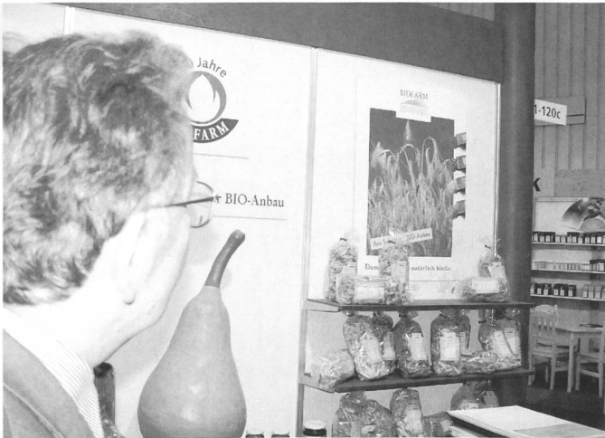
Ausstellungsstand der Biofarm