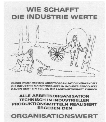
Tafel 2: Wie schafft die Industrie Werte?

Die zweite Art der Leistung ist wie oben schon erwähnt vor allem eine durch den Organisationsgrad, das heisst, durch den Grad der Arbeitsteilung der Gesellschaft erbrachte Leistung. Sie wird in der arbeitsteiligen Industrie – zusätzlich zur ersten Leistung der Hervorbringung von Naturstoffen – durch Organisation dieser Materie in der arbeitsteiligen Gesellschaft erzeugt. Diese arbeitsteilige Entwicklung der Wirtschaft ist aber nur möglich , wenn im Gegenzug die materiellen Basisgüter der Versorgung (Tafel 1) von immer weniger Menschen hervorgebracht werden, da ja diejenigen, die nun in Industrie und Dienstleistung arbeiten, von ihrer ehemaligen Selbstversorgung freigestellt werden müssen. Diese Leistung übernehmen für sie die in der Landwirtschaft zurückbleibenden Landwirte, welche mit Mitteln aus Gewerbe und Industrie ihre Leistungsfähigkeit erhöhen. Ohne die Definition eines wirtschaftlichen Gesamtverbandes , innerhalb dem sich diese Spezialisierungen gegenseitig herausbilden, ist eine gerechte, gegenseitige Preisbemessung nicht möglich. Die heutigen Theorien der Wohlstandsmehrung durch sogenannte «Markttöfnungen» blenden diesen Zusammenhang aus. (Tafel 2)