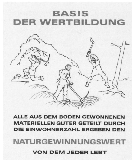
Tafel 1: Basis der Wertbildung; die dingliche Produktion an der Naturgrundlage.

Die Menschen erbringen grundsätzlich zwei verschiedene Formen von Leistungen. Erstens erzeugen die Menschen materielle, in Gewichten messbare Leistungen, wodurch materielle Dinge aus der Natur gewonnen und verbraucht werden. Die zweite Art der Leistungen sind organisatorische Leistungen, wodurch die aus der Natur gewonnenen Stoffe durch Arbeitsorganisation, Kombinatorik, also geistige, ingenieurmässige und wissenschaftliche Kreation umgeformt und zu neuartigen Produkten hergestellt werden. Die erste Art der Leistung ist kennzeichnend für die Subsistenzgesellschaft, die fast nur materielle Güter hervorbringt und sie selbst verzehrt. Auch in der arbeitsteiligen Gesellschaft ist die erste Art der Leistung ein Teil, oft ein verschwindend kleiner Teil – aber immer ein Teil des Endproduktes. (Tafel 1)