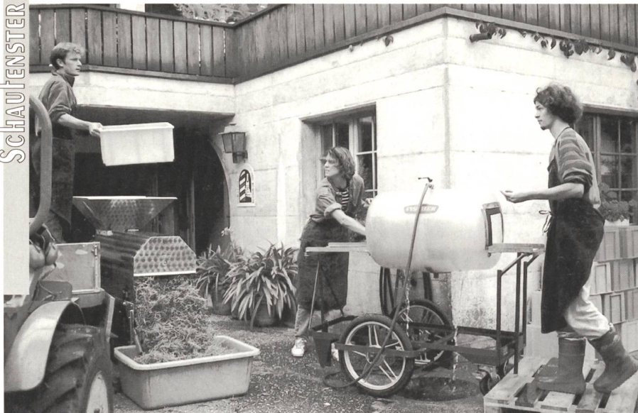
Abbeeren der Trauben.

Wir waren schon oft freundlich aufgenommene Gäste im FiBL, bei der BIO SUISSE und in der Biofarm. Auch innerhalb der Schweiz also eine schöne Zusammenarbeit. Ausserdem könnten wir ohne die vielen Spender gar nichts unternehmen.