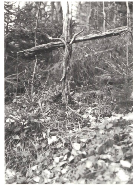
Das Pflegen und Entdecken unserer eigenen Ressourcen kann uns in Krisen stärken

Die Arbeit in der Landwirtschaft ist ein gutes Übungsfeld für Krisen und Chancen. Nicht nur in der heutigen Zeit; es war schon früher so. Als grosse Chancen entpuppten sich früher beispielsweise die Käseereignisse, die jetzt aufgrund einer Krise der Milchvermarktung geschlossen werden. 100 Jahre und mehr verpflichteten sich die Bauern, ihre Milch in die Käserei zu bringen. Zum Wohle aller, gemeinsam sind wir stark,