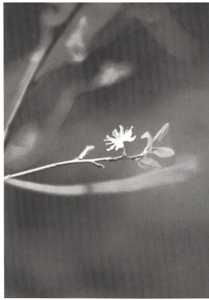
Durch den Umgang mit der Schöpfung wissen wir um den Frühling nach dem Winter

Nun aber wieder zur Gegenwart: In der Zwangspause nach dem Reitunfall wurde etwas in meinem Herzen verändert. Vorher konnte ich mich von der alten Verwundung nicht erholen, weil die Tage sich wie Perlen aneinander gereiht haben. Die nötigen Ruhezeiten für eine so tiefgehende Veränderung, ich kann sagen Heilung, fehlte einfach im Alltag. Ich spürte nun, dass sich das, was ich dachte, was andere von mir halten, in mir umdrehte. Das Fremdbild verbesserte sich zu meinen Gunsten. Aber auch mit meinem Bild der andern veränderte sich etwas: Jährelang hatte ich mit Ex-Drogenabhängigen gelebt und gearbeitet. Jetzt nahm ich selbst Valium und Morphium, um die Schmerzen des Beckenbruchs erträglich zu machen und spürte den Entzug nach zwei Monaten Konsum zunächst drastisch, bis sich der Körper wieder entwöhnt hatte. Plötzlich war mir klar, dass ich diesen jungen Menschen in der Vergangenheit oftmals nicht gerecht geworden war, dass ich nur wenig Verständnis für ihre Rückschläge hatte. Schuld bekennen