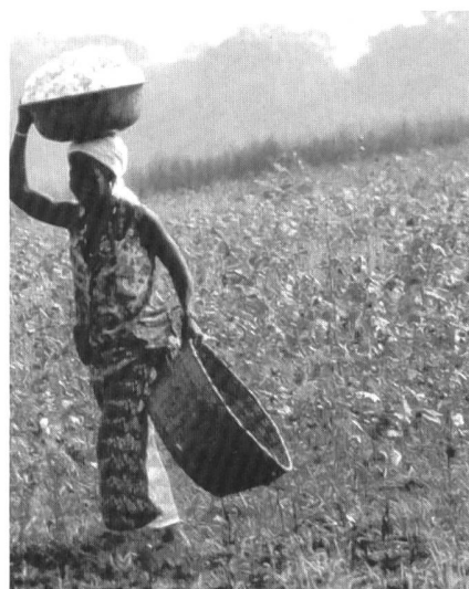
Korb um Korb wird in Togo die Baumwolle von Hand geerntet.

Es ist ohnehin so, dass, wenn der Kaffeepreis am Boden ist, das mit der Subventionierung der europäischen Landwirtschaft nichts zu tun hat. Wir erinnern uns noch sehr gut, als die ‚linken‘ Agronomen in den achtziger Jahren erklärten, der zerrüttete Kaffeepreis sei eine Folge der Subventionspolitik der Kaffeeanbauenden Staaten. Dann half die Weltbank die Subventionen zu beseitigen und der Kaffeepreis fiel erst recht in den Keller. Dabei hätte man klar sehen können, dass die Rohstoffe der Entwicklungsländer genauso systematisch unterbewertet sind wie die Bodenprodukte der Bauern in den Industrieländern. Umso unbegreiflicher ist es, dass auch in der den Bauern gehörenden landwirtschaftlichen Presse gewisse Journalisten Artikel einbringen können, die ‚neoliberales Papageiengeschwätz‘ gedankenlos nachplappern: «Der Aufbau eines landwirtschaftlichen Betriebes in der Wildnis Moçambiques erfordert viel Enthusiasmus, Durchhaltevermögen und Pioniergeist. Ausserdem erschweren die tiefen Weltmarktpreise, die von der hoch subventionierten Landwirtschaft der Industriestaaten künstlich tief gehalten werden, die Wirtschaft-