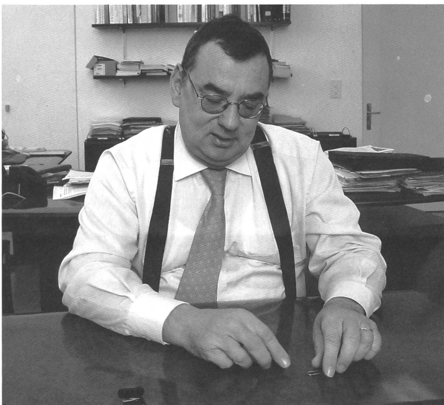
Sturierte mit einer Büroklammer ein Zoll-Exempel: WTO-Chefunterhändler Luzius Wasescha in seinem Berner Büro, Bundeshaus Ost.

Instrumente wie geografische Herkunftsbezeichnungen, die gewerblich hergestellte Spezialitäten im Nahrungsmittelbereich oder auch im Industriebereich schützen helfen. Dann die Abgeltungen der Umweltschutznormen. Wenn wir schon teurer produzieren, um die Umwelt zu schützen, dann sollten wir die Differenz zum Weltmarkt in Form von Direktzahlungen ausgleichen können. Das ist heute Teil der Greenbox. Wir möchten den Rahmen nun neu auch auf den Tierschutz ausweiten. Wobei ich in Genf bewusst auf Anträge zur Änderung der jetzigen Bestimmungen verzichtet habe, da man das auch in die heute formulierten Bestimmungen hineinlesen kann. Schlagen wir offiziell eine multilaterale Definition vor, wird das Endresultat sicher nicht so, wie wir uns das vorstellen. Also lieber Bestehendes levantinisch interpretieren, als teutonisch Perfektes vorschlagen, das dann nicht Bestand hat.