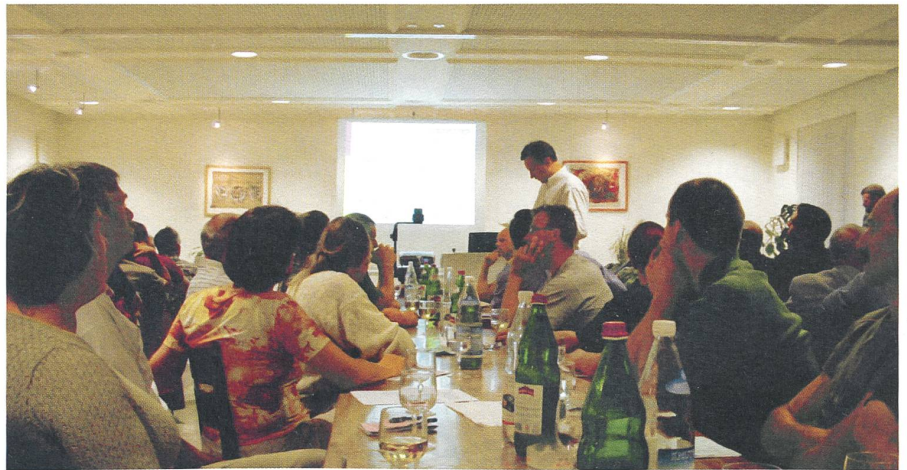
Zum Beispiel im Restaurant Brauerei in Sursee: BTA-KundInnen trafen sich mit der BTA-Spitze und einer Bio Suisse-Gastdelegation zu einem Informationsabend.

Jetzt stehen die eigenständige Zertifizierungsstelle als Teil der Bio Suisse und die Öffnung der Zertifizierung als zwei Lösungsansätze konkret zur Debatte. Für die Öffnung braucht es an der DV eine Zweidrittelsmehrheit, für die eigenständige Zertifizierungsfirma das normale Mehr. Bei der Öffnung verliert die bio.inspecta nur rund 20 Prozent ihrer Zertifizierungen, mit einer neuen Zertifizierungsstelle der Bio Suisse aber 80 Prozent! Das tut natürlich mehr weh. Die Präsidenten wollen nicht zuletzt deshalb an der DV vom 15. November beide Varianten in einem fairen Abstimmungsprozedere zur Abstimmung bringen. Nimmt es die Zweidrittelschürde, kann man die Öffnung machen. Hat die selbständige