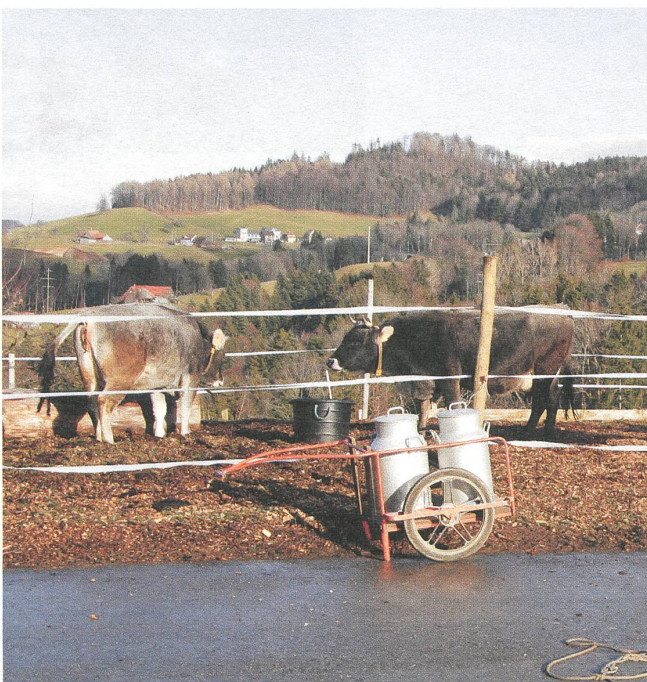
Winterauslauf für räthisches Grawieh.