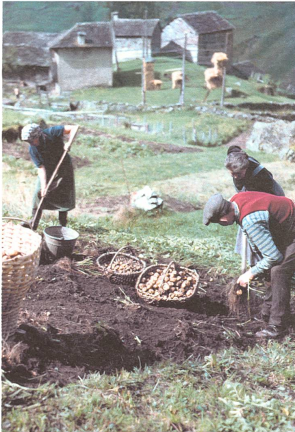
Die bäuerliche Landwirtschaft schafft Ressourcen und hat geschlossene Kreisläufe. Kartoffellesen in Malvaglia (Aus: Peter Ammon: Schweizer Bergleben um 1950)

neuerbarer Energien. Davon sind wir heute meilenweit entfernt. Der grösste Teil unserer Wirtschaft ist auf Wachstum und Gewinnmaximierung ausgerichtet. Ein Wachstum, das Ressourcen verbraucht und auf Kosten schwächerer Volksgruppen geht, ist kein echtes Wachstum. In der Natur hat jedes Wachstum natürliche Grenzen, und was stirbt, kehrt in den Kreislauf zurück und generiert neues Wachstum, ohne der Umwelt zu schaden.