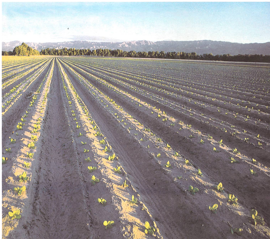
Die industrielle Landwirtschaft schadet Boden- und Sozialstrukturen

Die Menschheit zahlt die Entwertung der Nahrungsmittel mit vielen Zivilisationskrankheiten wie Herz-Kreislaufkrankungen, Krebs und Immunschwäche, Allergien und so weiter. Das Ergebnis dieser Entwicklung sind die explo-