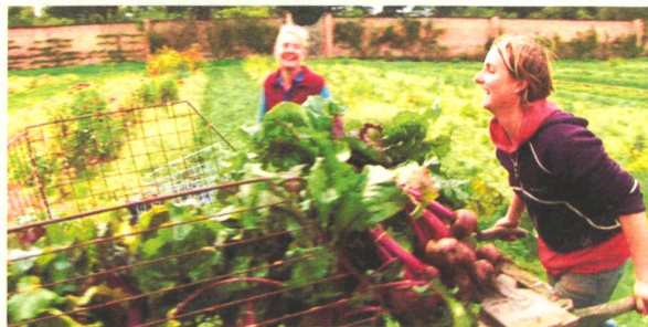
Randenernte auf der Leigh Court Farm in Bristol.