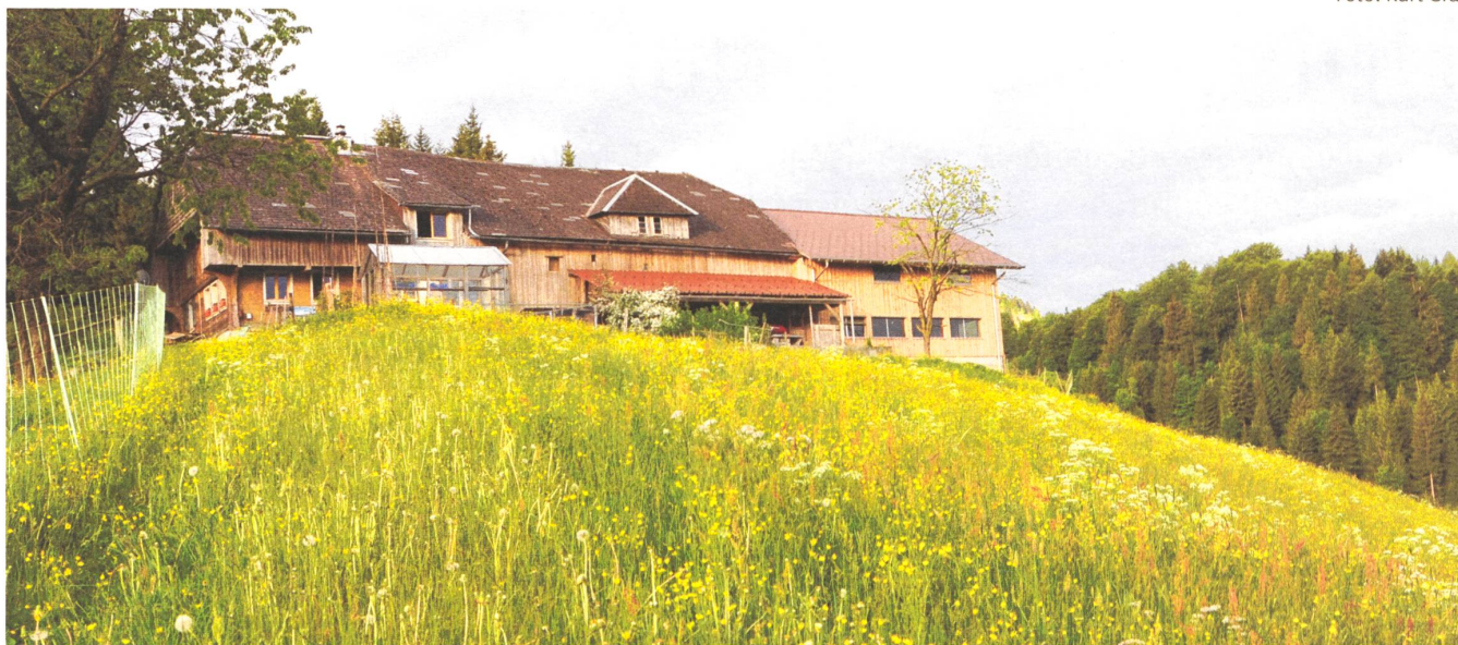
Abgelegen und idyllisch: der Biohof «Chrutose».

vom Käsen. «Aber wenn ich dann die Käserei herausputze und einwintere, überkommt mich immer eine gewisse Wehmut. Ich werde mir bewusst: Jetzt ist es vorbei, für dieses Jahr.»