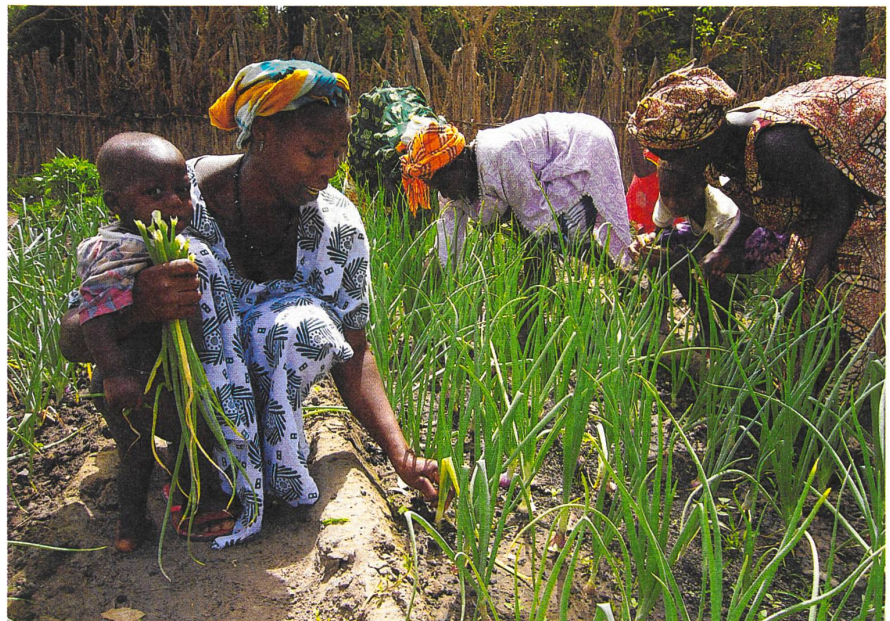
Ein Bio-Gemeinschaftsgarten in Guinea-Bissau.

Die Bauern in Afrika und Südamerika haben mich gelehrt, dass die moderne Wissenschaft nicht alles erklären kann. Die Kunst besteht darin, die Umwelt zu beobachten, Reaktionen von Tieren und Pflanzen zu erkennen und daraus Schlüsse für das richtige Handeln zu ziehen. Oft fehlen die Erklärungen, warum etwas