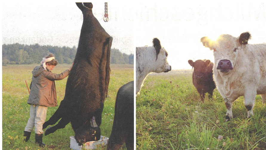
Demeter-Bäuerin Sonja Moor und ihre Galloway-Rinder (nahe Berlin).

«Weideschlachtung» spricht die Menschen an. Eine kleine Mitteilung des Landwirtschaft-