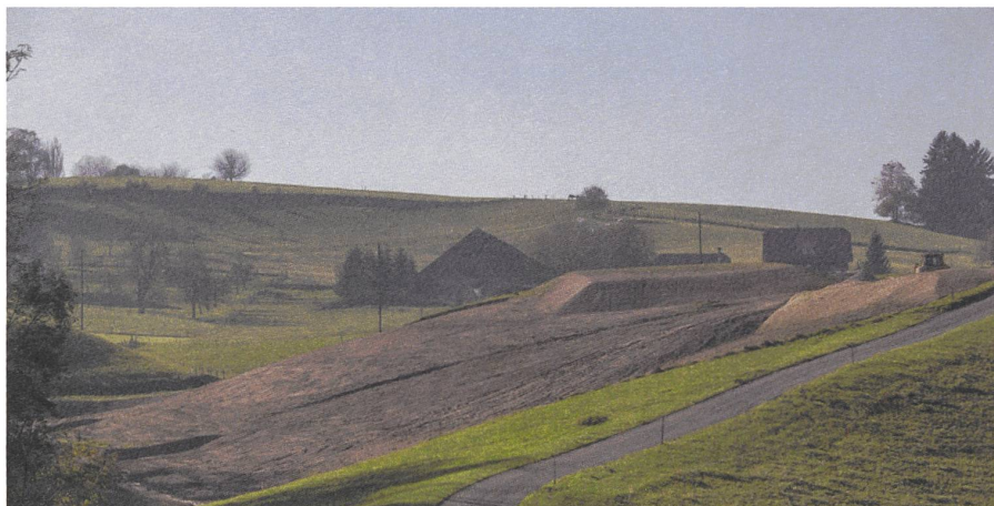
Die Wiederverwendung des Oberbodens kann nicht darüber hinwegtäuschen, dass Kulturland verloren geht.