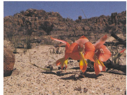
Nach dem Bodenverlust nach historischer Entwaldung und neuem Buschfeuer. <Cedar-berge>, Südafrika

Widerstehen wir dabei aber der Versuchung einer manipulativen Hervorrufung (teilweise) unbewusster Vorstellungen, wie sie in Politik und Marketing allzu oft geschieht. Dann kann eine ethische Verbindung wissenschaftlicher Aussagen, archetypischer Muster und kultureller Botschaften, die den Einzelnen in