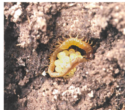
Ekelfaktor, Boden-Schatz?

Neben dem christlichen Gottesbild und Mythos prägte auch die christliche Ethik die Beziehung des Abendlandes zum Boden. Über eine autoritäre oder ökologische Auslegung der Genesis und ihrer populären Formulierung «machtet euch die Erde Untertan» wurde in den letzten Jahrzehnten lebhaft diskutiert. Zuletzt hat sich Papst Franziskus in seiner Enzyklika «Laudato sí» mutig für eine liebevolle, geschwisterlich-ökologische Naturbeziehung und für eine Abkehr vom bisherigen radikalen Anthropozentrismus der Kurie ausgesprochen.