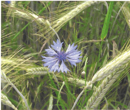
Die mit dem Korn zu uns gekommene Kornblume wurde zu einem Symbol für <Unkraut> – und Agrarökologie!

Einige religiöse und spirituelle Aspekte der Bodenbeziehung wurden von Biolandbau-Pionieren konstruktiv weitergetragen, während die Wissenschaft ansonsten einen staubtrockenen Rationalismus pflegte. Im vorherrschenden naturwissenschaftlichen Paradigma gilt: Emotionen und Gefühle bleiben als „subjektiv“ und Privatsache aussen vor. Deshalb führen sogenannte <irrationale> Antriebe und nicht ganz rationalisierbare Elemente des Welt- und Selbstbildes von Forscher(inne)n und Landbebauenden ein besonderes Eigenleben , das sich wohl auf ihren Umgang mit dem Boden auswirkt, aber auch ziemlich unbewusst und deshalb wenig reflektiert bleibt.