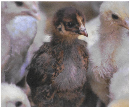
«Deindustrialisierte» Kükenaufzucht.

Es gibt einiges, was viele engagierte Hühnerbauern gerne ändern würden. Erstens die weltweit fast totale Abhängigkeit auch des Biobereichs von Hendrix Genetics aus Holland, der Erich-Wes-Johann Gruppe aus Deutschland und der Gimaude Gruppe aus