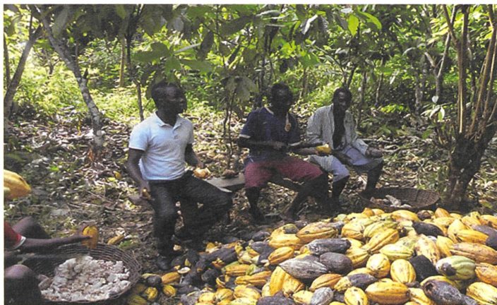
Dieses Bild wird auf der Nachhaltigkeitsseite von Lindt gezeigt.

Weiter sollte die Produktion von Hybridsamen an private Unternehmer übergeben werden. Zurzeit ist das Kakaoforschungsinstitut von Ghana nicht in der Lage, die nötige