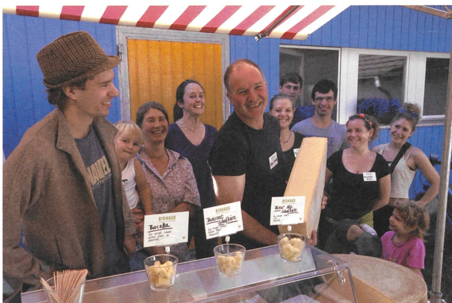
Kaistenberger Rohmilch Hartkäse am FiBL-Märitstand.

Anstatt alle zwei Tage 400 bis 800 Kilo Milch transportieren wir nun alle zwei bis drei Wochen 200 bis 300 Kilo Käse. So gelangen, je nach Ausbeute, pro 100 Kilo produzierte Milch nur ungefähr neun Kilo Käse auf die Strasse. Den Rest, die Molke, verfüttern wir den Wollschweinen auf dem Hof.