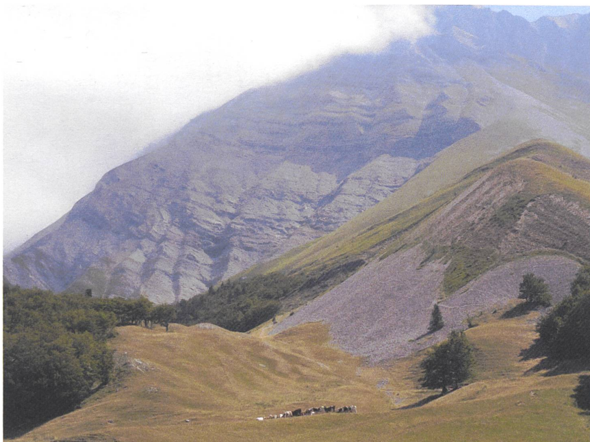
In den französischen Alpen.