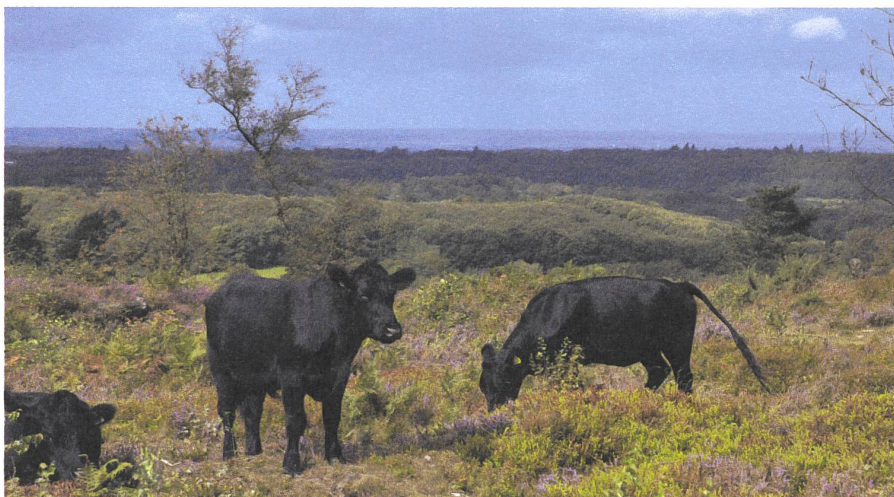
Grasende Rinder in den Süddünen.