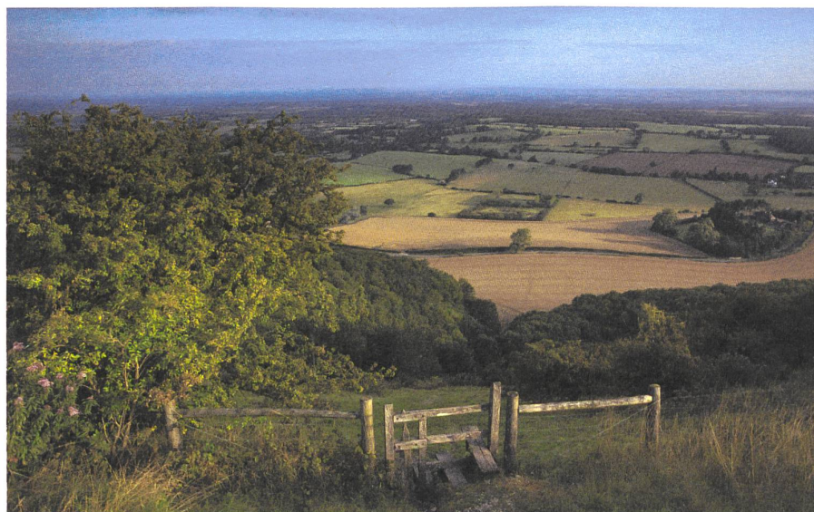
Blick von der Hügelkette «Teufelsdeich» aus nach Norden.

Geradezu beschwörend endet diese eindrückliche Dokumentation mit den Worten: Die Süddünen enthalten nicht nur verschiedene schöne Flecken von Natur und kulturellem Interesse, sie sind geradezu durchsetzt mit Natur und Kultur – und dies ist, was uns in unserer Arbeit beflügelt.