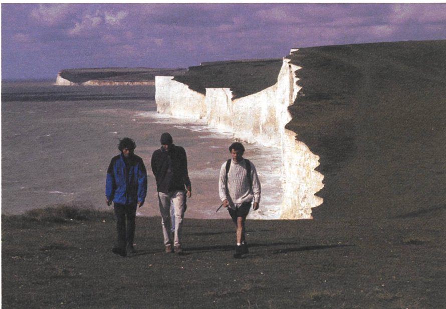
Ein Süsswasserstrom und später das Meer liess die beeindruckenden Kreide-Kliffs entstehen.

Gemäss dem National Trust gelten Nationalparks als Landschaften von aussergewöhnlicher Schönheit, geformt von der Natur und den lokalen Gemeinschaften, die dort leben. Der «South Downs Nationalpark» ist der jüngste der insgesamt 15 Nationalparks im Vereinigten Königreich. Er liegt in den Süddünen, einer hügeligen Kreidelandschaft im Süden Englands, in den Grafschaften East Sussex, West Sussex und Hampshire. Diese gehört zur südenglischen Kreideformation. Wer kennt sie nicht, die «white cliffs of