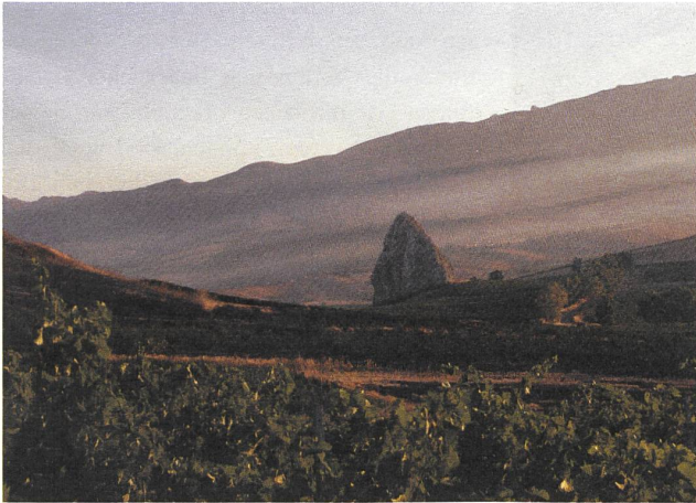
Sizilianische Landschaften mit Oliven, Reben, Getreide.

Auf der nur in einer Sprache bedruckten Packung hatte ich ein mir bisher unbekanntes Label entdeckt: Le terre libere dalle mafie. Land, befreit aus der Macht der Mafia. Es versetzte mich unwillkürlich in den Alltag des Bauern bzw. in längst vergangene Ferien in Sizilien zurück. Wird nun bald die Wasserpumpe für den Olivenhain defekt sein? Kommen demnächst die Kinder mit seltsam verschlossenen Augen aus der Schule nach Hause? Werde ich morgen beim Grubbern des Weizenfeldes – mit Blick über den griechischen Tempel aufs Meer hinaus – samt Traktor von einer Mine in die Luft gerissen?