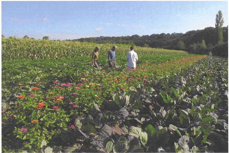
Mitarbeiter im Streifen der Zucchettizüchtung