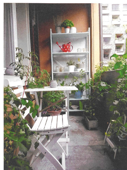
Tomaten im Mikroklima der Stadt.

Heute wird das formelle Saatgutssystem von Hybridsorten und patentiertem Saatgut dominiert. Von diesen Pflanzen kann und darf kein eigenes Saatgut mehr nachgezogen werden. Wer solche Sorten sät, muss die Samen jährlich neu zukaufen. Die Folgen sind bekannt. In der europäischen Landwirtschaft werden immer weniger Pflanzenarten angebaut. 98% der in der Schweiz verwendeten Gemüsesamen sind importiert. Sowohl global als auch in der Schweiz verschwinden bewährte, traditionelle Charaktersorten. Bereits zu Beginn der 1980er Jahre wurde auf die weltweite Saatgutproblematik aufmerksam gemacht. 4 Seither ist die Monopolisierung massiv fortgeschritten. Multinationale Konzerne dominieren das formelle Saatgutssystem immer stärker. Der Zusammenschluss von DowDuPont, die Übernahme von Syngenta durch ChemChina und der