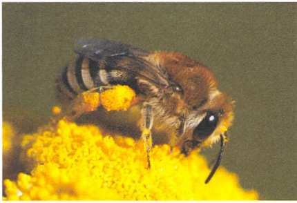
Eine Seidenbiene.

Körpergewicht ausgesetzt sind, was auf die Dauer schädlich für sie ist. Wie auch für andere Bestäuber – Wildbienen, Hummeln, Schmetterlinge usw. – und, weiter gefasst, für alle nützlichen Insekten und die ganze Lebensmittelkette, bis zum Menschen.