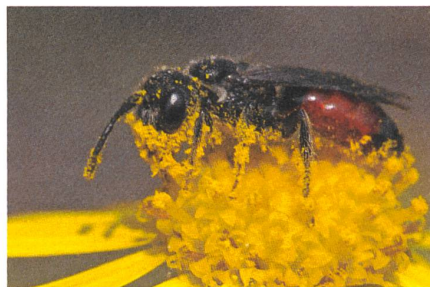
Eine Blutbiene.

EM: Genau da liegt die Herausforderung: Der biologische Bienenhalter müsste seinen Bienenstock in eine ausschliesslich biologische Landschaft stellen. Aber wo findet man heute noch solche Orte? Mein Berufskolle-