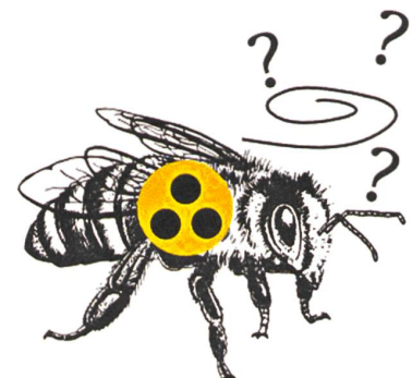
Grafik aus der Kampagne des EU-Parlamentarier Martin Häusling gegen Neonikotinoide.

EM: Ich bin Bodenamöbenspezialist. Bodenamöben sind auch hilfreiche Bioindikatoren, welche die Verschmutzung z. B. mit