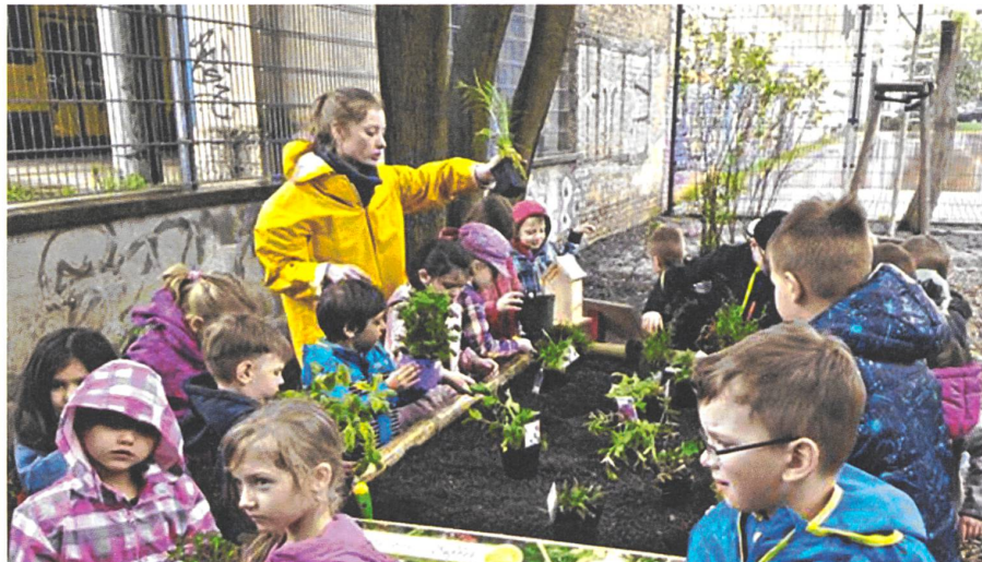
Bei den Kleinen anfangen. Aber nicht aufhören.