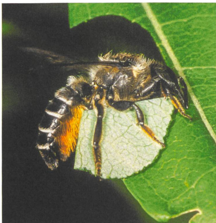
Die hiesige Blattschneiderbiene

Die sogenannte Krefelder Langzeitstudie von 2017 hat deutlich gezeigt, dass selbst in Naturschutzgebieten die reine Insekten-Biomasse –