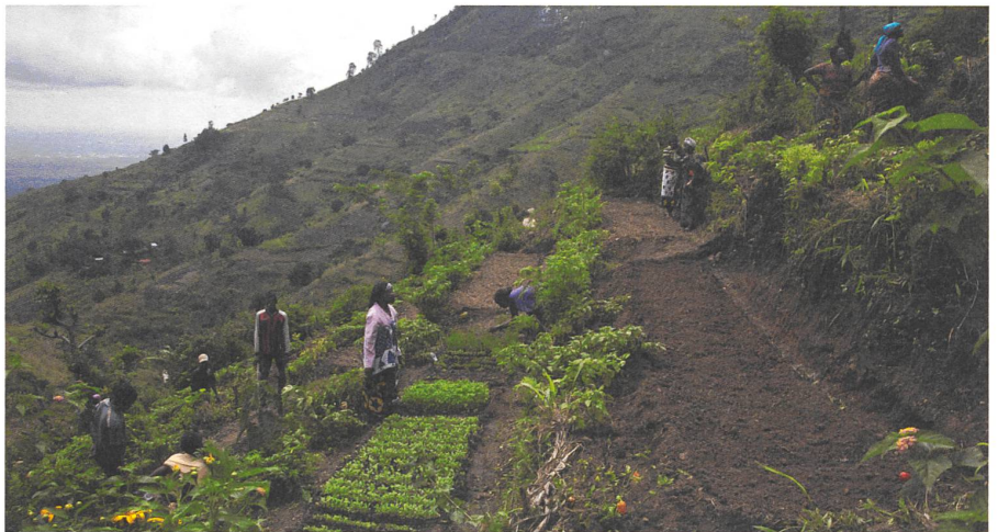
Der terrasierte Trainingsgarten der Bauerngruppe «Maendeleo» in den Uluguru Bergen bewährt sich.

Zu Beginn seiner Zeit in Tansania fand Wostry auf einer Reise durch Ostafrika viele seiner Bedenken gegenüber Entwicklungsprojekten bestätigt. «Aber ich sah