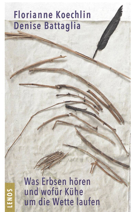
Florianne Koechlin und Denise Battaglia: Was Erbsen hören und wofür Kühe um die Wette laufen. Verblüffendes aus der Pflanzen- und Tierwelt, 263 Seiten, September 2018.

Das Buch ist ein Lesegenuss und zugleich voller Wissen aus der Welt der wissenschaftlichen und bäuerlichen Erkenntnisse. ●