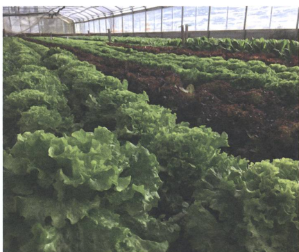
Ein Blick in den ungeheizten Folientunnel des Jaklhofs bei Graz, Weihnachten 2018.