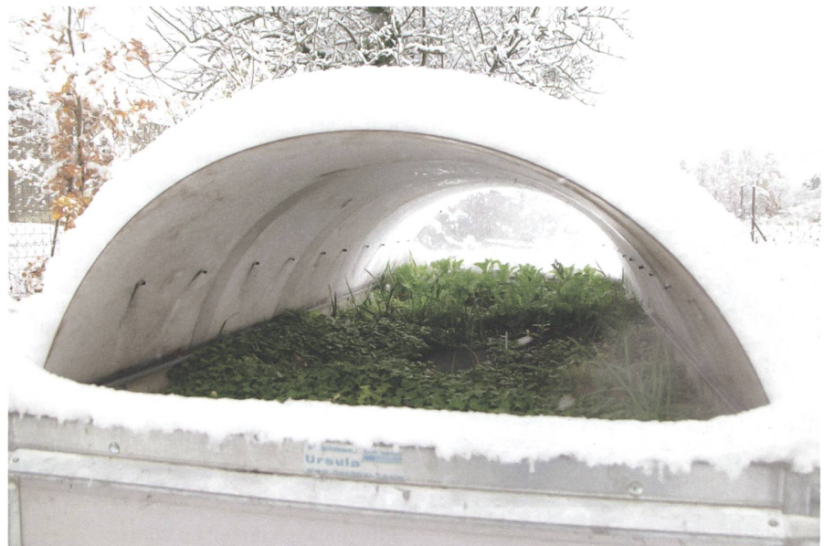
Hochbeethaube: Einige Sorten ertragen die Kälte, nicht aber Schnee und Durchnässung.

Die klassischen Wurzelgemüse wie Rote Rüben (Bete), Karotten oder Pastinake werden traditionell im Spätherbst gerodet und meist über Winter in Kühlräumen gelagert.