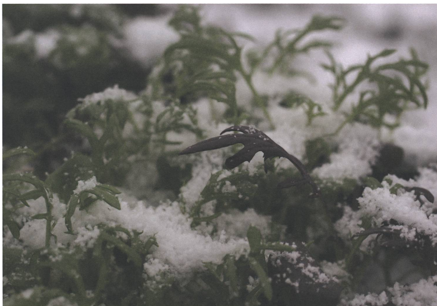
Asia-Salate wie Pak Choi, Mizuna oder Blattsenf sind ideale Wintergemüse, die wesentlich frostfester sind, als es in den Lehrbüchern steht.

Der heutige Lebensmittelhandel scheint tatsächlich vom Wechsel der Jahreszeiten völlig unbeeindruckt zu sein. Sommers wie winters finden wir im Supermarkt das volle Gemüsesortiment an Salaten, Gurken, Tomaten und Paprika. Nur der Blick aufs Kleingedruckte am Etikett zeigt uns die gewaltigen Unterschiede bei der Herkunft. So ist der Winter im Handel die Jahreszeit der Gemüseimporte aus südlichen Ländern oder