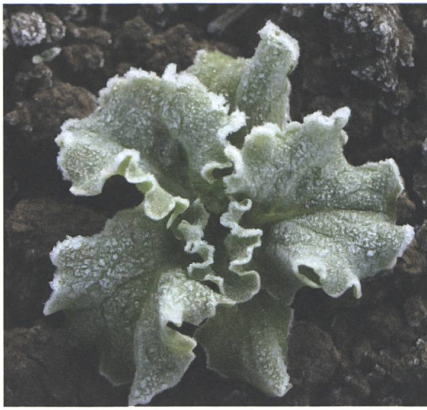
Gefrorener Salat: Viele Nutzpflanzen sind mit allem ausgerüstet, um winterliche Frostperioden unbeschädigt zu überstehen.

der heimischen Ware aus geheizten und oft künstlich beleuchteten Gewächshäusern. Beides ist eine energieintensive Angelegenheit mit allen ökologischen Auswirkungen, die uns die Freude an den gut bestückten Regalen verderben können. So zahlen wir mit aufwändiger Technik und ressourcenfressender Logistik auch ökonomisch einen hohen Preis für Frischprodukte, die wir mit wesentlich einfacheren Mitteln gewinnen könnten.