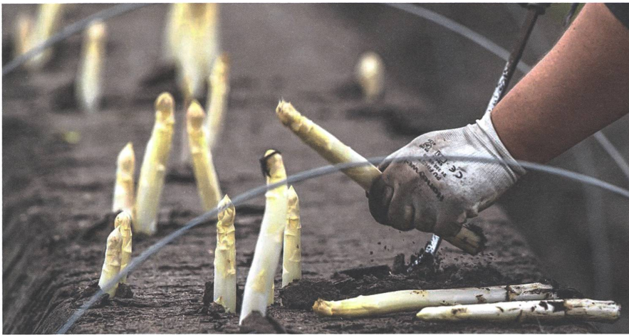
Mit diesem Bild berichtete der Südkurier Konstanz am 2. April: «Wegen der sich ausbreitenden Corona-Pandemie fehlen in diesem Jahr die erfahrenen Erntehelfer aus dem osteuropäischen Ausland.»

guten Seiten von Nachbarschaft bekamen eine Plattform, nicht nur einen Balkon. Alles im Namen der Solidarität.