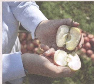
Hochwertige, geprüfte Rohstoffe