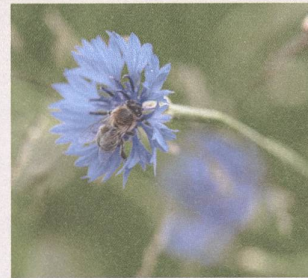
Intakte Natur durch biologische Vielfalt