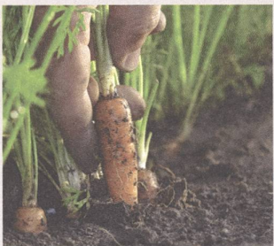
Bio-Anbau seit über 60 Jahren