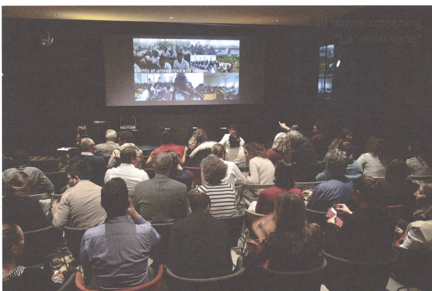
Teil der Veranstaltungsreihe war auch eine Filmpremierre. Hier on Screen «La veine verte» in Bern im Rahmen der Dokumentarforschung 2021.