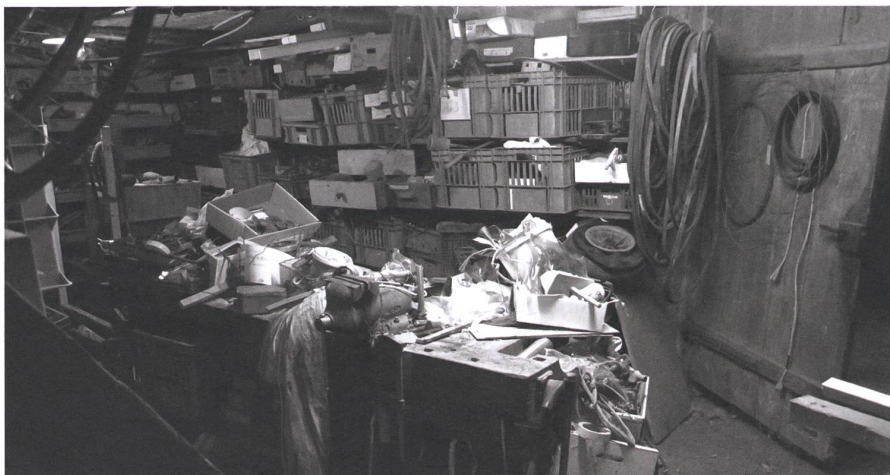
Wo ein geübtes Auge eine «leichte Überlastung» diagnostizieren würde.

viel Erfahrung und Routine, sodass sie kaum von jemand anderem gemacht werden könnten. Für das Arbeiten in der Pflanzung, für das Gemüseernten, -rüsten und -waschen, für Sortierarbeiten über den Herbst-Winter, für das Paratmachen des Hofladens und das Verkaufen haben wir ein gutes Frauenteam im Stundenlohn anstellen können. Auch einen Teil der Aufräumarbeiten brauchen wir seit kurzem nicht mehr selbst zu machen.