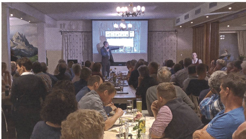
So sieht das dann in Bayern aus.

Die «lebensbezogenen Zusammenhänge» der regionalen Rinderhaltung mit Milch, Kalb, Kuh und Masttieren sowie die Bedeutung des Ökogrünlands und der Rinder für die Böden, die Lebensvielfalt und das Klima müssten den Essenden wieder klargemacht werden. «Die Erhaltung von biodiverserem Grünland braucht Menschen, die Rindfleisch essen!» Aber in Deutschland zum Beispiel habe sich der Rindfleischkonsum seit 1960 zugunsten von Geflügel- und Schweinefleisch fast halbiert und macht jetzt nur noch 15% aller Fleischgerichte aus – es kommen viel zu hohe rund 83% von Schwein und Geflügel. Dabei sei die Rinderhaltung für den gesamten Ökolandbau systemisch unverzichtbar, denn 57% der ökologisch bewirtschafteten Flächen in D sind Grünland, dazu kommt das Klee-gras