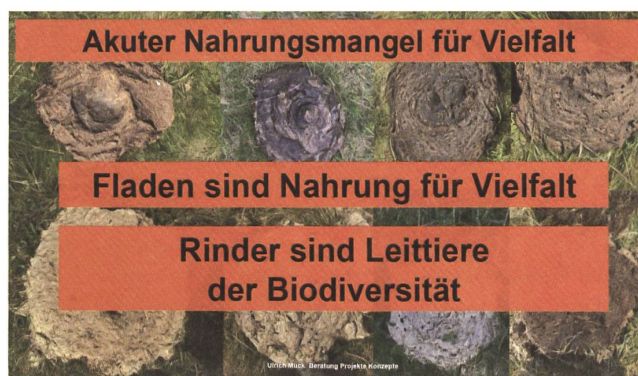
Auch die plakativen Folien sprechen die Zuhörer an.

ner- und Schweinefleischverbrauch.» Denn von Grünland lebende Rinder sind keine Nahrungskonkurrenten des Menschen. Entgegen landläufigen Annahmen haben Rinder «die höchste Lebensmittel-Konversions-Effizienz» aller Nutztiere: Bei nur 10 % lebensmitteltauglichem Futteranteil verwandeln sie, was sie fressen, gemäss einer wissenschaftlichen Studie für den Alpenraum «3,5-mal (Energie) bzw. 4,2-mal (Eiweiss) besser als Masthühner oder Schweine in das Lebensmittel Fleisch».