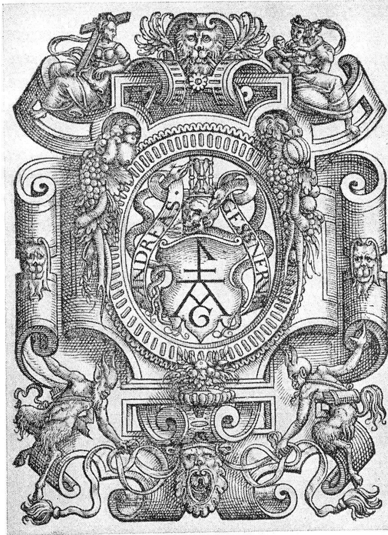
Abb. 2: Büchermarke der Offizin Gessner (Heitz Nr. 35).