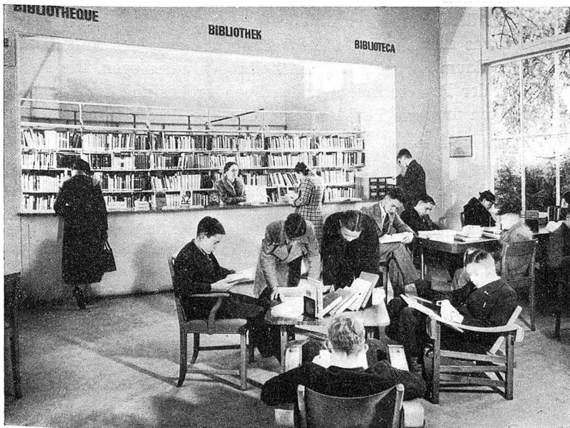
Blick gegen die Bücherausgabe