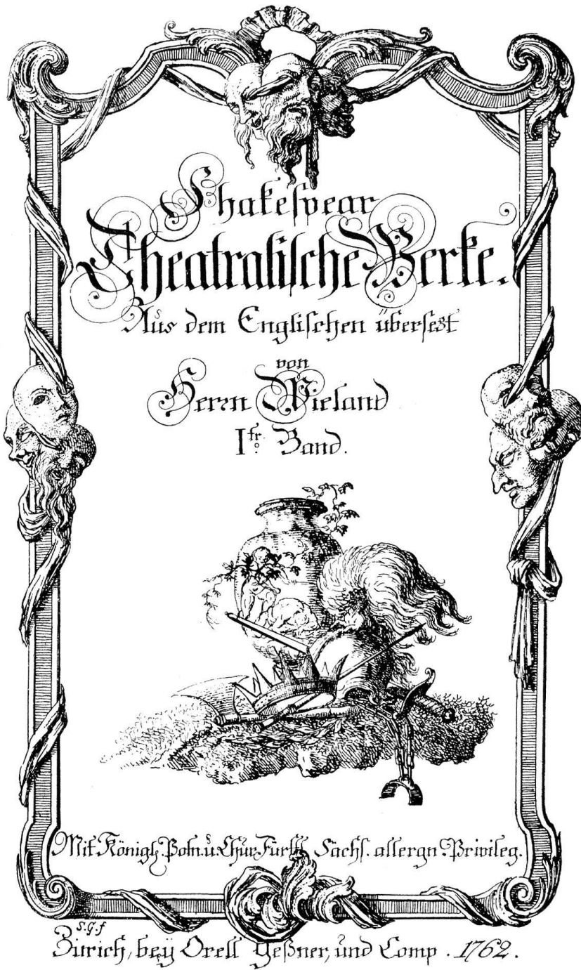
Titelblatt von Band 1 der ersten Zürcher Shakespeare-Ausgabe, radiert von Salomon Geßner