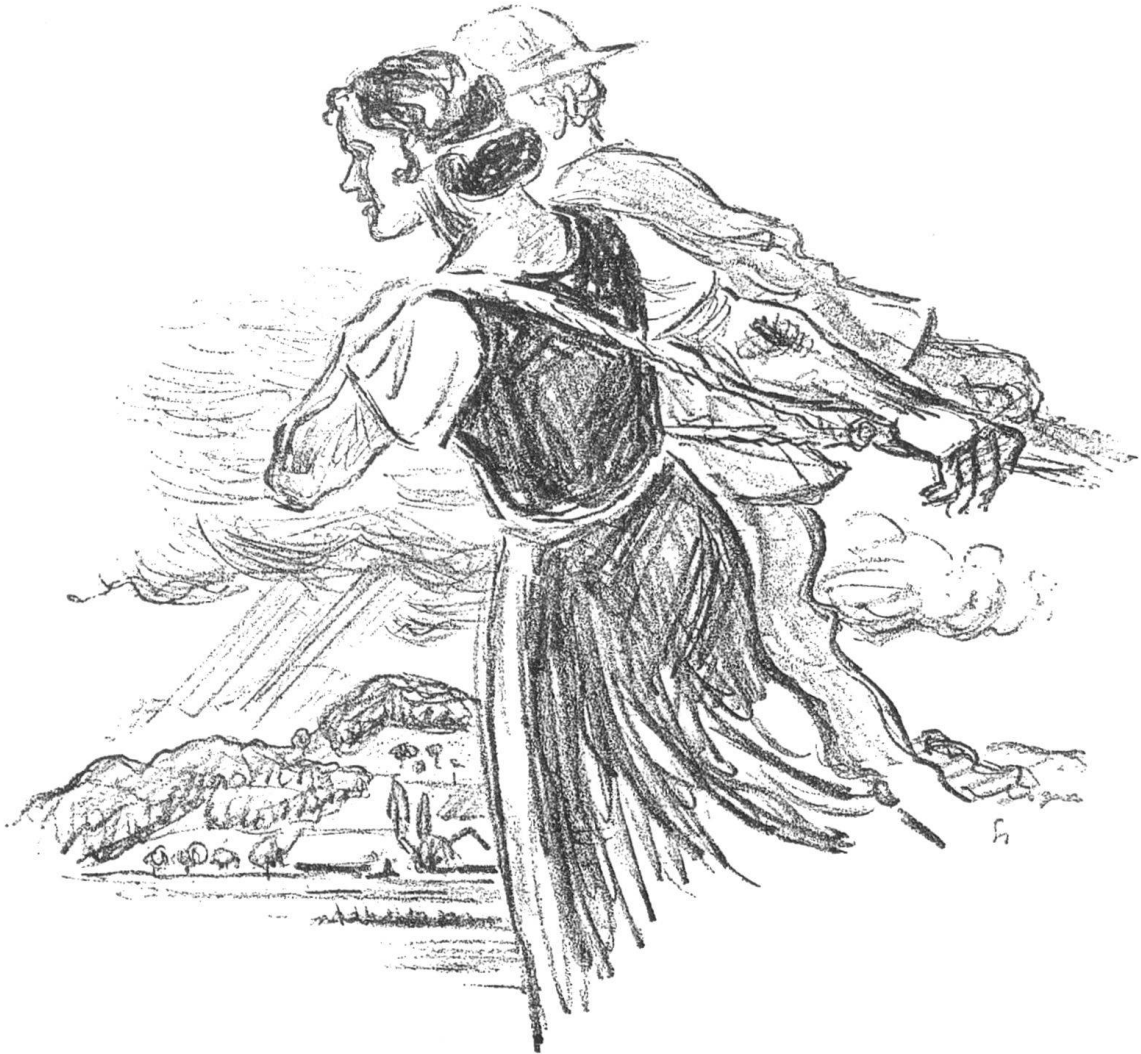
Fred Stauffer | Illustration zu Gotthelf: Der Besenbinder von Rychiswyl