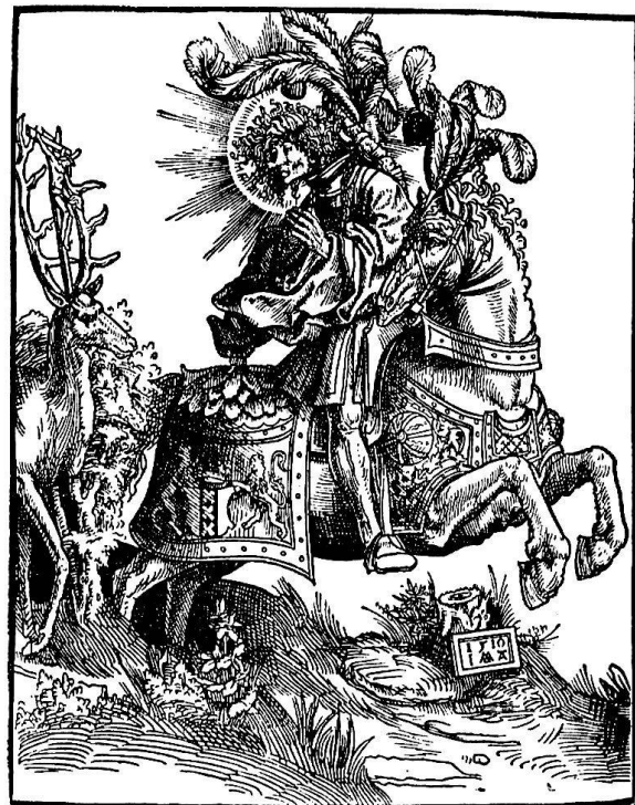
Jacob Cornelisz van Oostanen (1470–1533): Vision des hl. Hubertus zu Pferde. Holzchnitt von 1510

Wie lohnend ist es, sich in den Geist der Legenden zu versetzen! Die wunderbaren Beschreibungen und Geschichten edler Gestalten brachten in jenen dunkeln Jahrhunderten Erbauung und galten als Vorbilder zur Erweckung ähnlicher Tugend und Andacht. Eine wahre Fundgrube eröffnete sich mir, als ich auf der Suche nach ein-