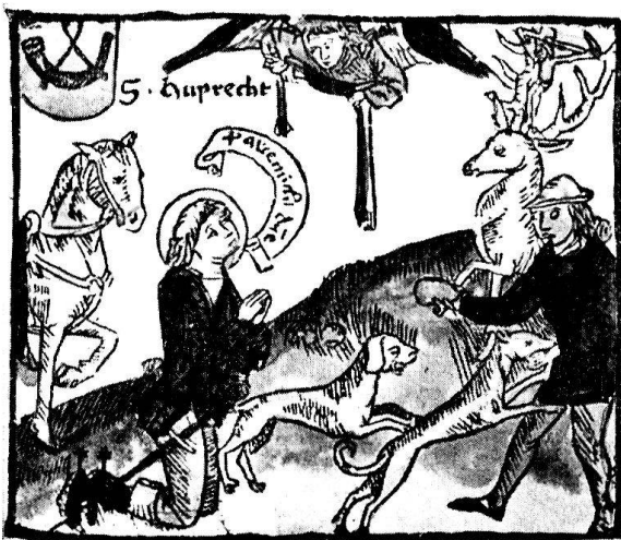
Anonym. Luxemburg? Ende 15. Jahrhundert. «S. Huprecht», zwischen Pferd und Hirsch kniend. Kolorierter Einblattholzschmitt, eingeklebt in «Pars aestivalis breviarii fratrum observantia ord. S. Benedicti». Nürnberg, Georg Stuchs, 1493. Zürich, Zentralbibliothek