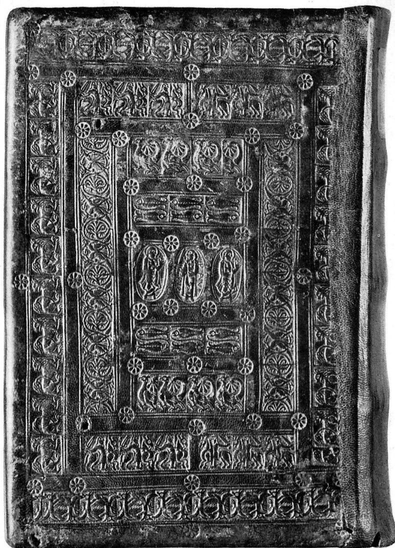
Rückseite des Buchdeckels Cod. 78 der Handschriftensammlung im Stift Engelberg