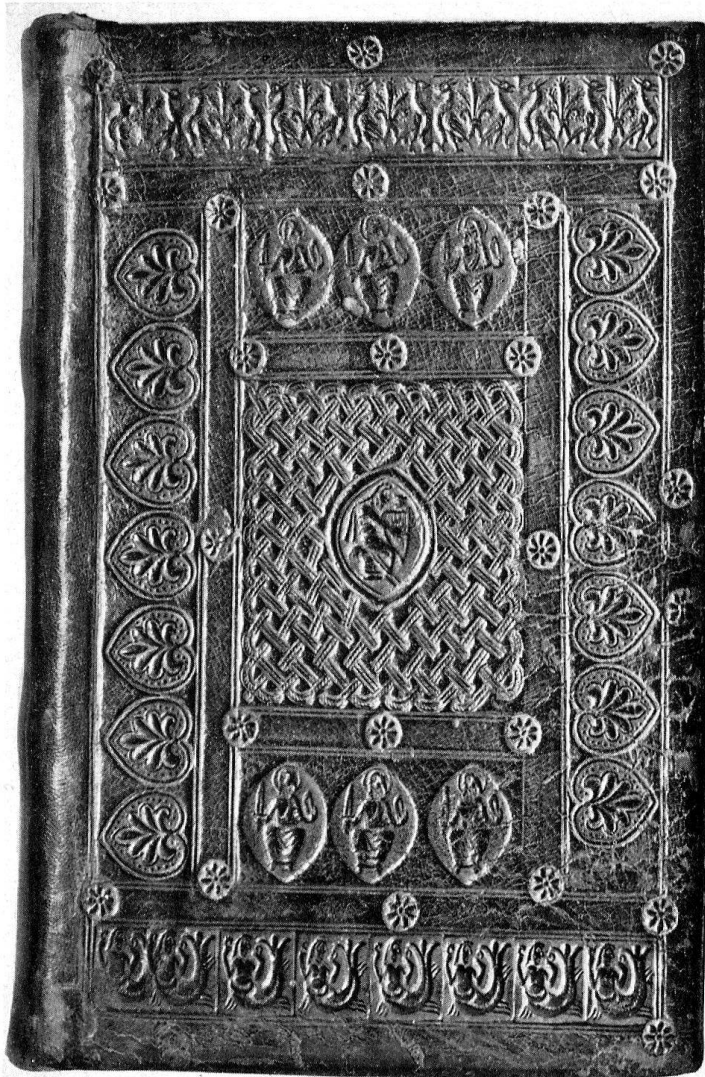
Vorderseite des Buchdeckels Cod. 82 der Handschriftensammlung im Stift Engelberg