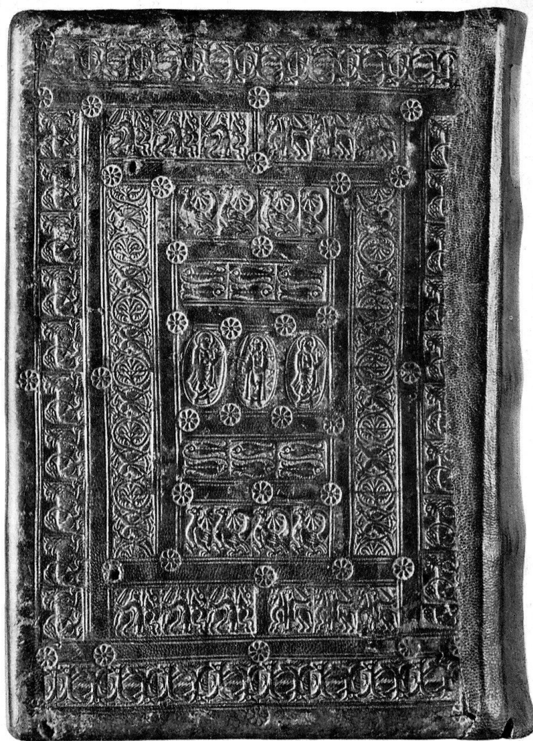
Rückseite des Buchdeckels Cod. 78 der Handschriftensammlung im Stift Engelberg