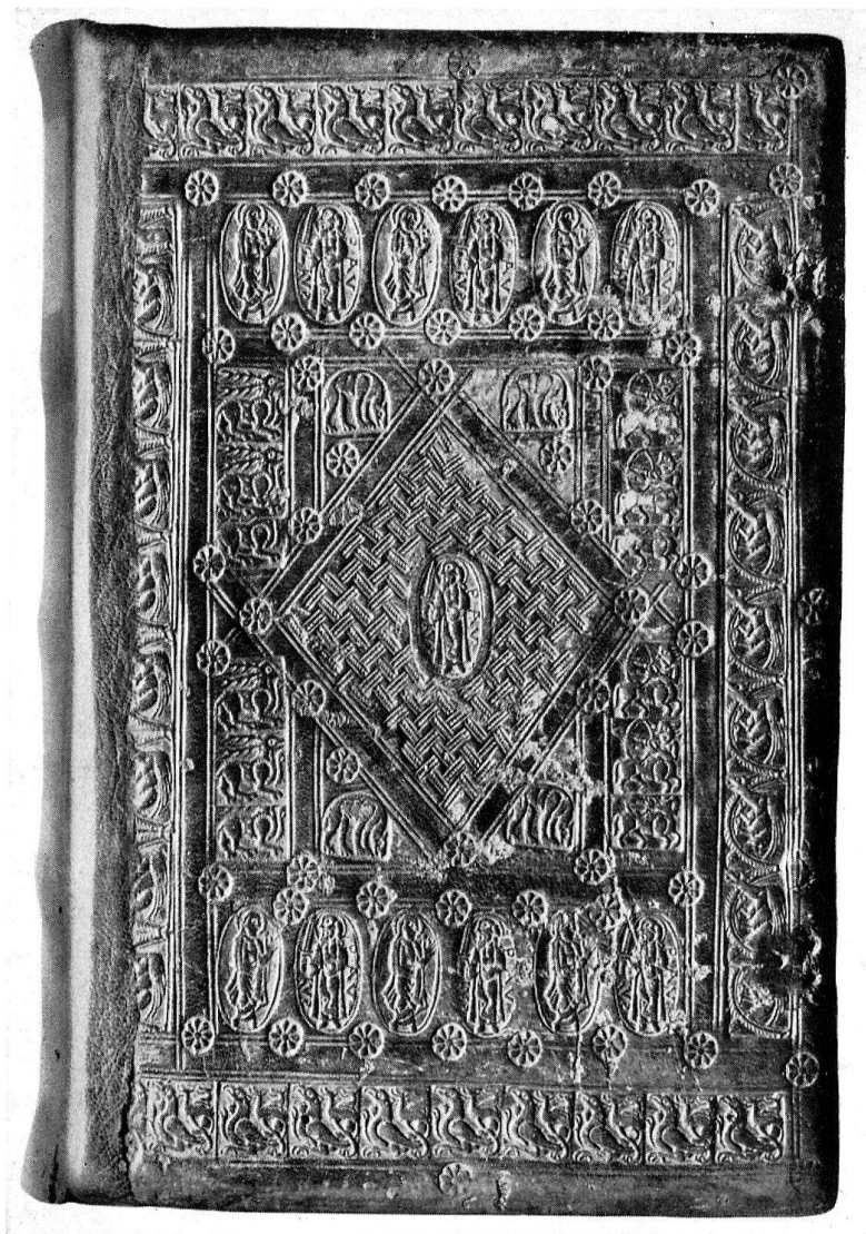
Vorderseite des Buchdeckels Cod. 78 der Handschriftensammlung im Stift Engelberg