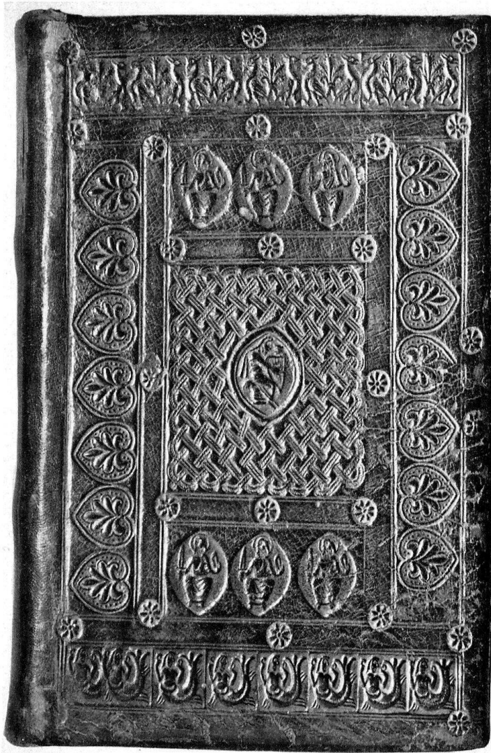
Vorderseite des Buchdeckels Cod. 82 der Handschriftensammlung im Stift Engelberg