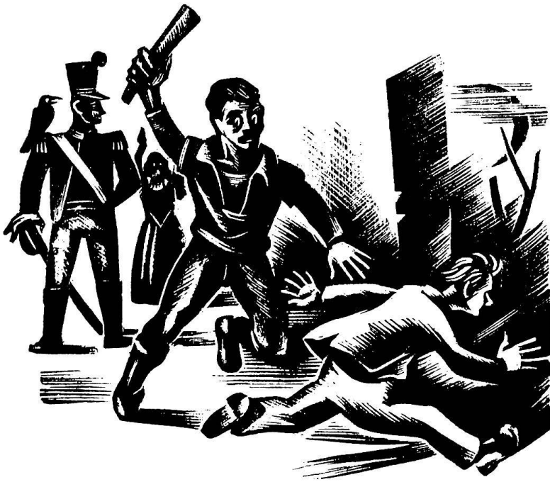
Aldo Patocchi / d'après le bois original paru dans Walter Keller: «Am Kaminfeuer der Tessiner». Edition Müller, Zurich

auxquels la main du poète-artisan a donné un cachet particulièrement attrayant.