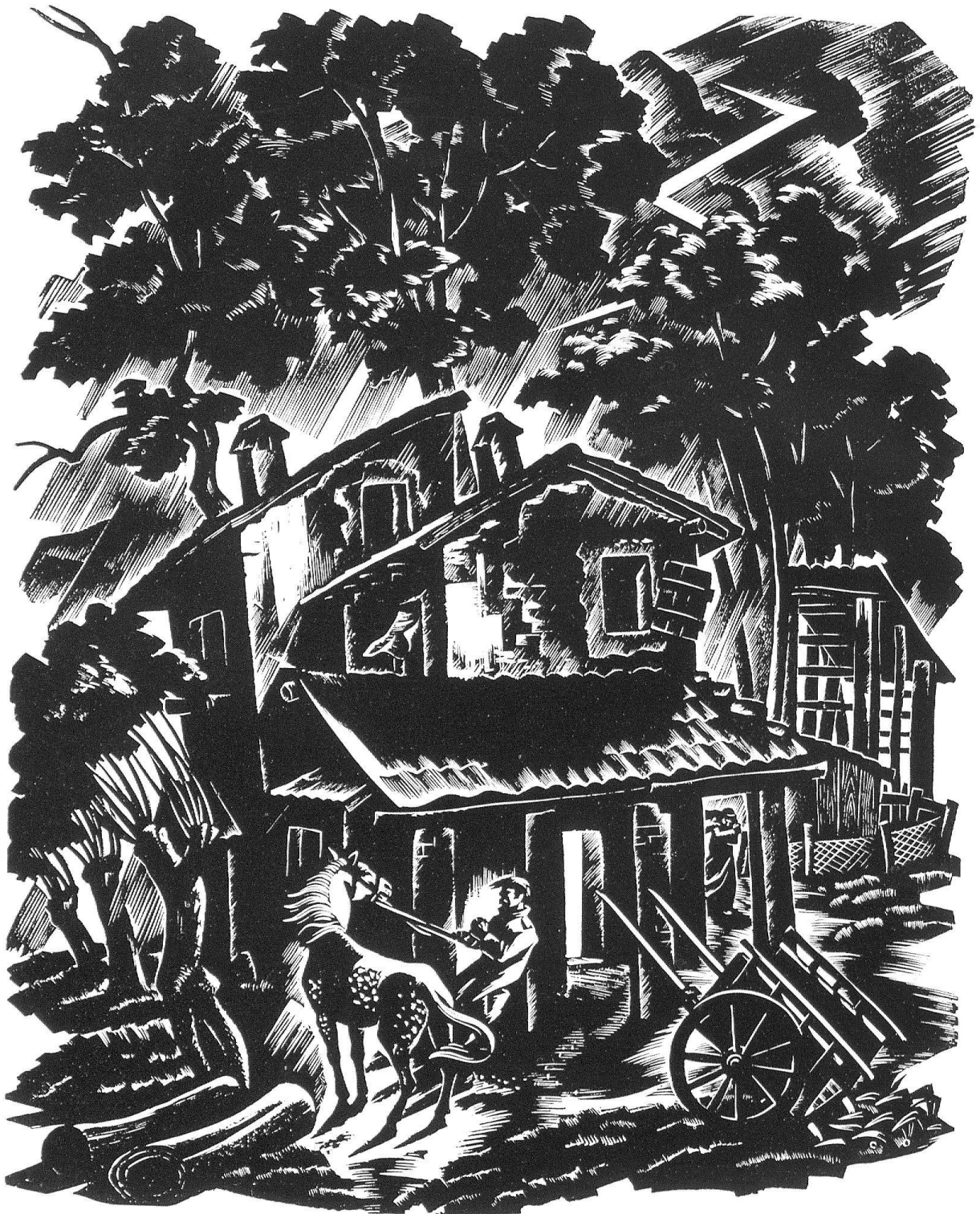
Aldo Patocchi / d'après le bois original «Der Blitzstrahl» de la suite «Das Tessin der Armen», avec préface de Henri de Ziegler. Edition Courvoisier, La Chaux-de-Fonds