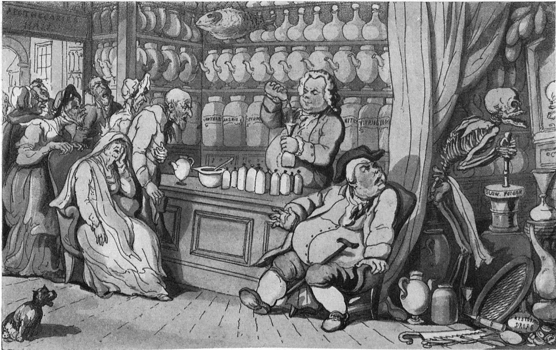
The Quack Doctor.

I have a secret art to cure Each malady, which men endure.