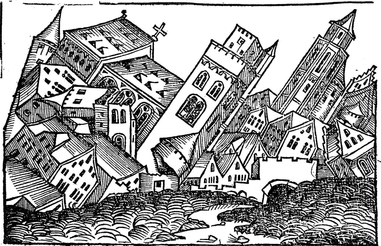
Abb. 9. Das zerstörte Babylon