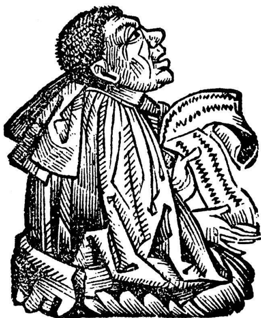
Abb. 11. Das Bildnis des Sokrates wird kühn weiterverwendet, Philippus, König der Mazedonier darzustellen

Ausdruck lautet, «gerissen»; die Schneidearbeit besorgten die Formschneider, indem sie den weiß gebliebenen Grund wegschnitten und die (meistens mit der Feder) schwarz gerissenen Linien stehen ließen. Der «Schnitt des Holzes» hat den Künstler gar nicht interessiert; das Schneiden gehörte zur Vervielfältigungstechnik wie etwa heute das Klischieren. Dank der damaligen