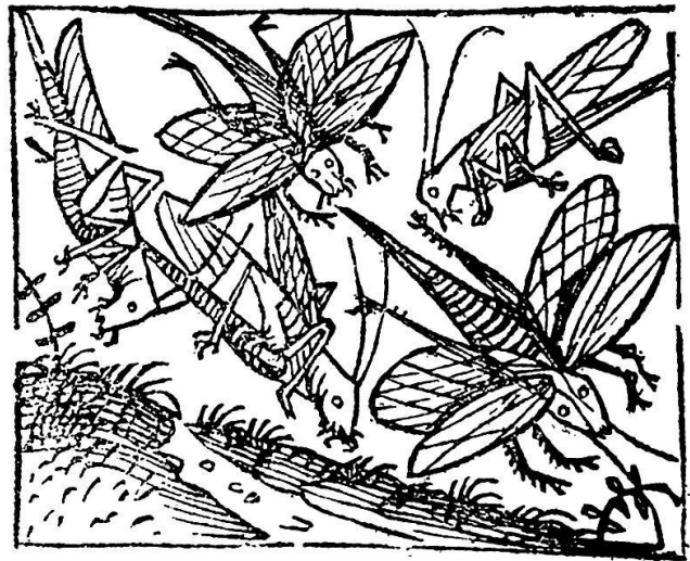
Abb. 16. Heuschreckenplage im 14. Jahrhundert, «an Zahl vom Aufgang bis zum Niedergang [der Sonne] wie ein dicker Wolk den Himmel überziehend»

1491 einen Vertrag über Druck und Bebilderung des Schedelschen Chronik-Manuskriptes geschlossen; die beiden Künstler werden verpflichtet, nicht nur die Holzschnitte zu reißen, sondern auch die formgerechte und ästhetisch befriedigende Einfügung in den Text, also den Umbruch, zu überwachen. (Der Vertragstext ist abgedruckt bei Gumbel in «Repetitorium für Kunstwissenschaft», Bd. 25, 1902, S. 430ff.). Schon gut drei Wochen später, am 21. Januar 1492, liefern die Künstler die Holzschnittmodel ab und erhalten das vereinbarte, wahrhaft fürstliche Honorar von tausend rheinischen Gulden, eine Summe, deren Kaufwert annähernd zwanzigtausend heutigen Schweizerfranken entsprach. Es war im buchstäblichen Sinn eine «Akkordarbeit», denn an die tausend Zeichnungen mußten sie während dieser drei Wochen reißen. Geschnitten wurden die Stöcke in der Werkstätte Koburgers. Beim Umbruch haben die beiden Künstler viele Holzstöcke mehrmals ver-