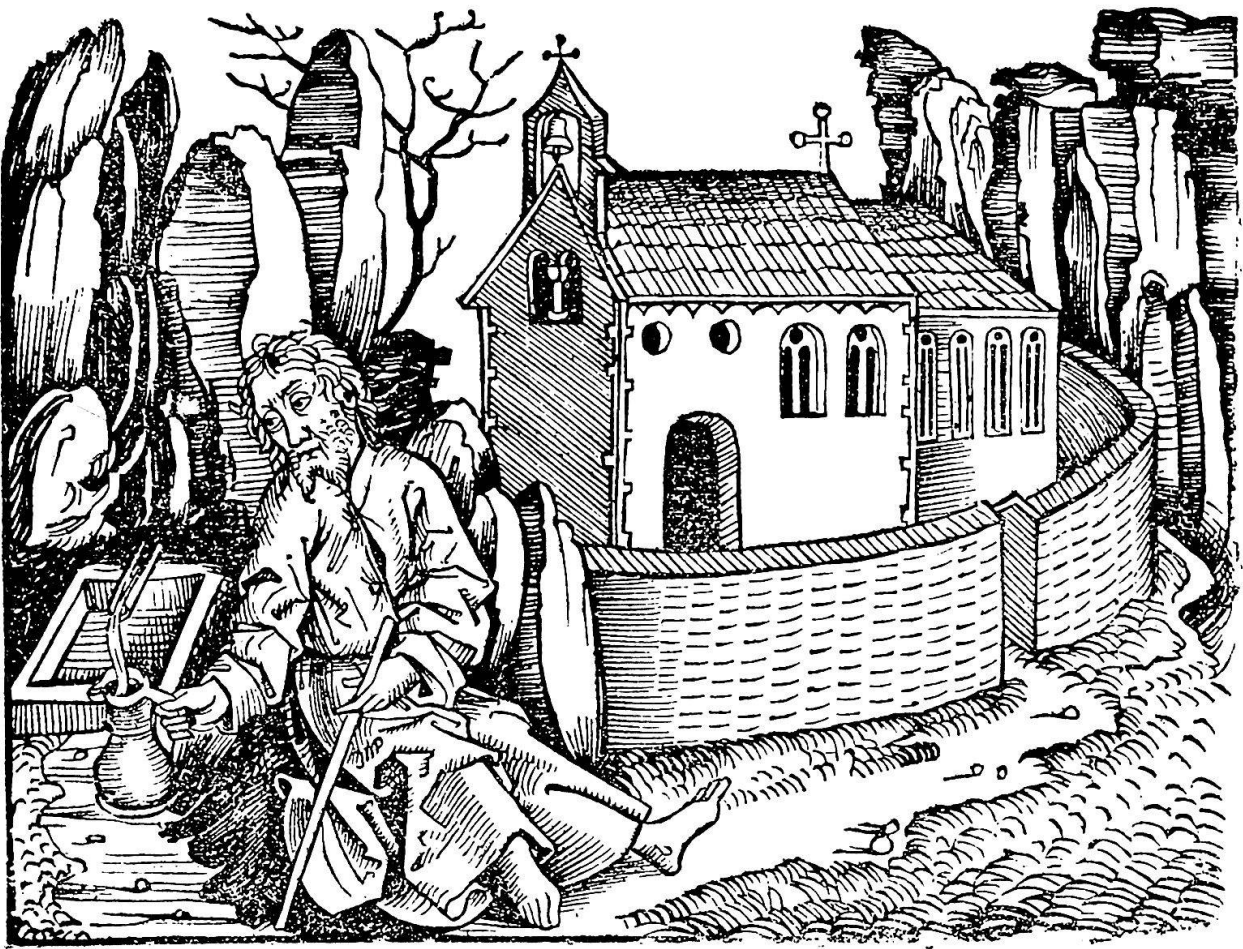
Abb. 21. Bruder Klaus im Ranft. 1487 starb Nikolaus von Flüe. Diese Abbildung, zeitlich die sechste uns erhaltene Darstellung, ist demnach spätestens 5 Jahre nach seinem Tode entstanden

Wie ist entlich beschlossen das büch der Cronicken vnd gedechtnus würdigern geschichtē vō anbegyn̄ 8 werlt bis auf dise vnßere zeit vō hohgelertē mannē in latein mit großem fleiß vnd rechtfertigung versamelt. vnd durch Georgium alten defmals losungschreiber zu Würmberg auß dēselben latein zu zeiten von maynung zu maynung. vnnnd beyweylen (nit on vrsach) außzugs weise in dis teütsch gebracht. vnnnd darnach durch den erbern vnnnd achtpern Anthonien Koberger daselbst zu Würmberg gedruckt. auf anregüg vnd begern der erbern vnd weysen Sebalden schreyers vnd Sebastian kamermaisters burgere daselbst. vnd auch mitanhangung Michael wolgemüz vnnnd Wilhelm pleyden wurffs maler daselbst auch mitburger die dis werck mit figuren wercklich geziert haben. Volbracht am̄. xxiiij. tag des monats Decembriß Nach der gepurt Cristi vnßers haylands M. cccc. xciiij. iar.