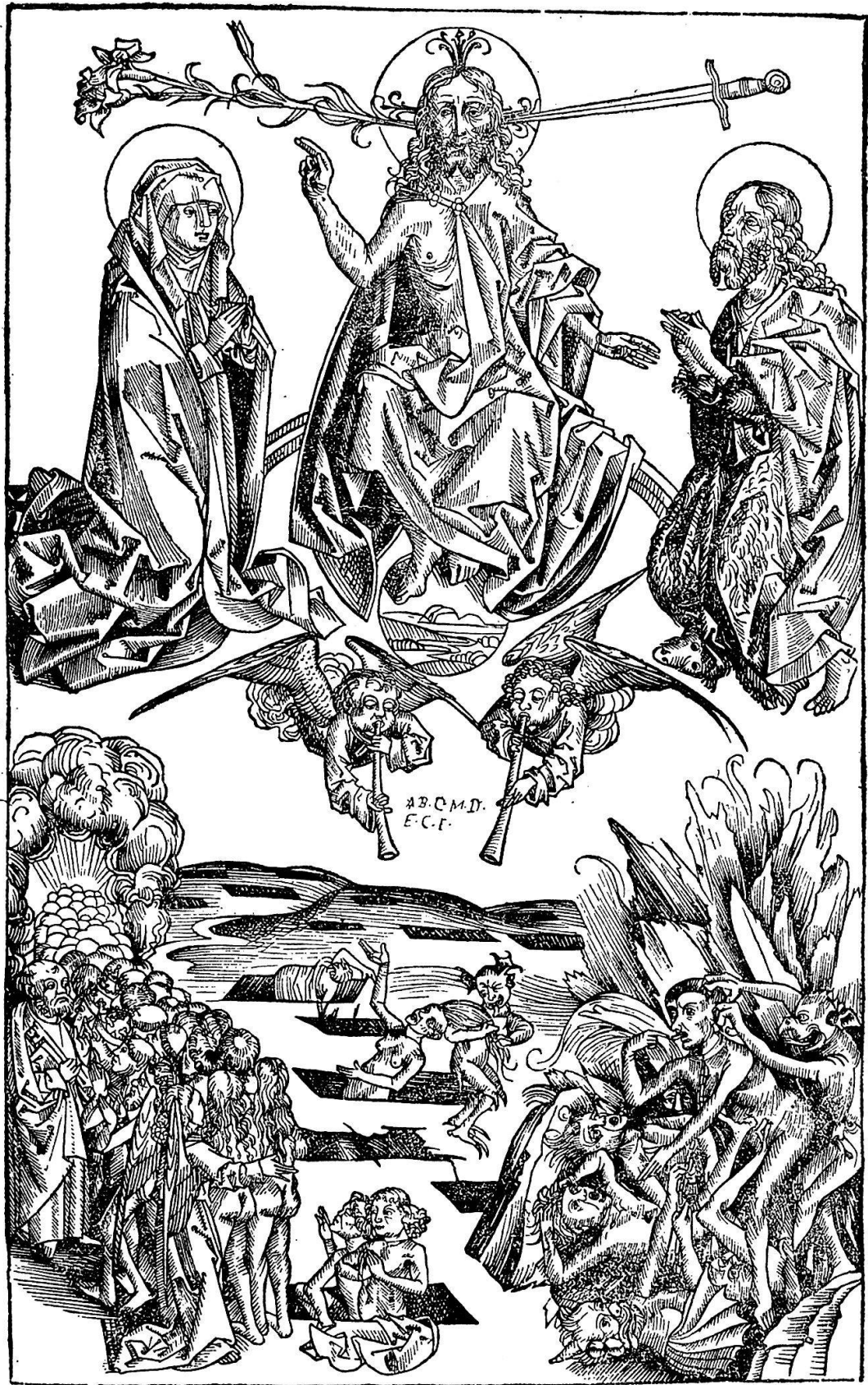
Abb. 20. Die Auferstehung der Toten und das Jüngste Gericht. Die weichere Linienführung, der Versuch, mit Halbschatten zu arbeiten, soll auf Michael Wohlgemut als Urheber deuten. Das Totentanzblatt und dies obige zeigen auf alle Fälle deutlich die beiden künstlerischen Grenzfälle, zwischen die sich alle übrigen Schnitte einreihen lassen