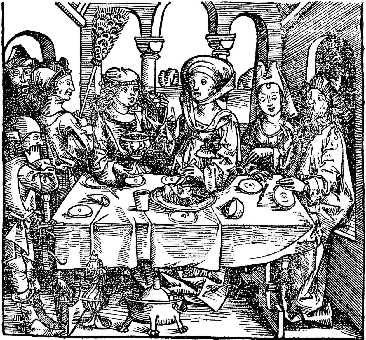
Abb. 13. Salome mit dem Haupt des Johannes