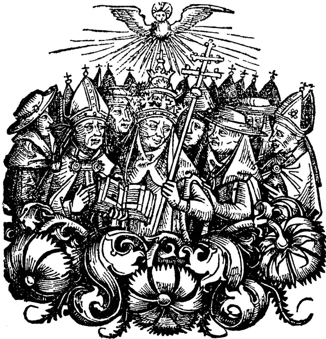
Abb. 14. Konzil von 731 unter Papst Gregor III. zur Beilegung des zwischen der griechischen und römischen Kirche entbrannten Bildstreites