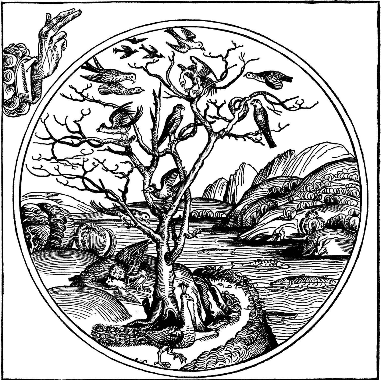
Abb. 3. Der fünfte Schöpfungstag: Die Erschaffung der Tierwelt

berühmten Willibald Pirckheimer, der blutjung am 24. März 1496 an der denkwürdigen Nürnberger Stadtratssitzung teilnehmen wird, wo erstmals die Humanistenpartei entscheidend siegt – dem humanistischen Bildungserlebnis nach. Nicht nur den antiken Klassikern, auch den zeitgenössischen italienischen Humanisten, unter ihnen namentlich dem Florentiner Poggio, gilt die Liebe dieser jungen Leute, denen der Humanismus sich zu einem Lebensideal verdichtet, das ihr Leitstern bleibt. Schedel erhält am 7. April 1466 seine medizinische Doktorwürde. Nach vielen Reisen kreuz und quer durch Deutschland und die Niederlande läßt er sich