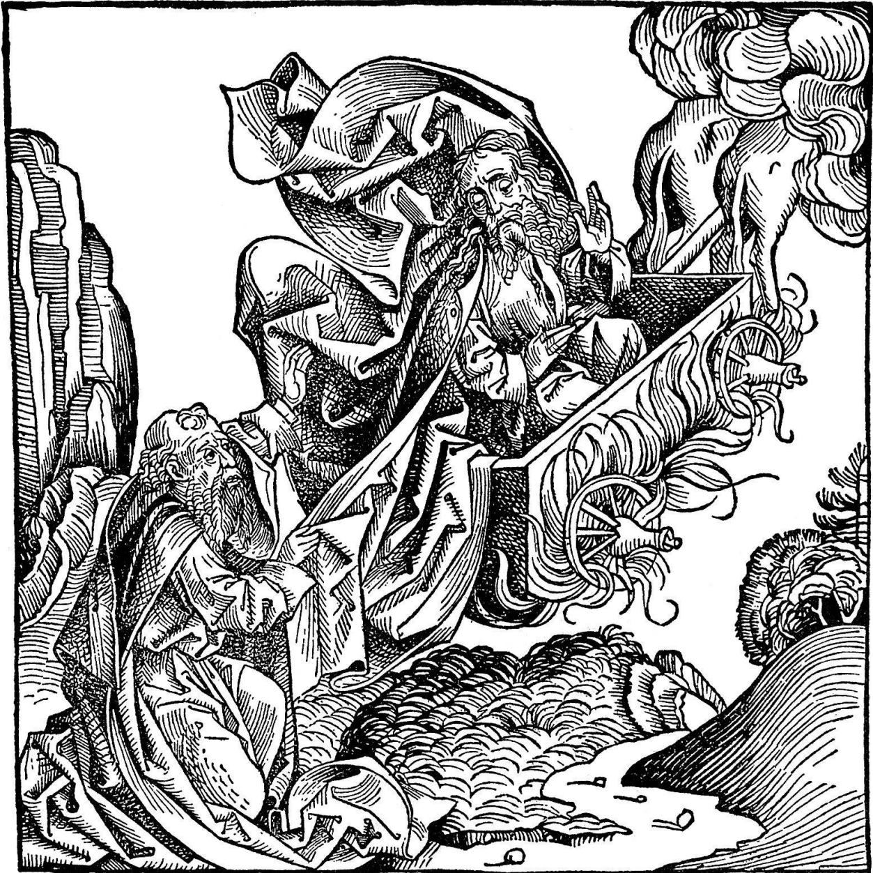
Abb. 6. Der Prophet Elias auf dem Feuerwagen gen Himmel fahrend

möglichkeiten zu nutzen gewußt und damit wesentlich beigetragen, daß der vor-Dürersche Holzschnitt, den die Kunstgeschichtsschreibung des 19. Jahrhunderts im großen und ganzen abschätzig als «roh» und «primitiv» charakteri-