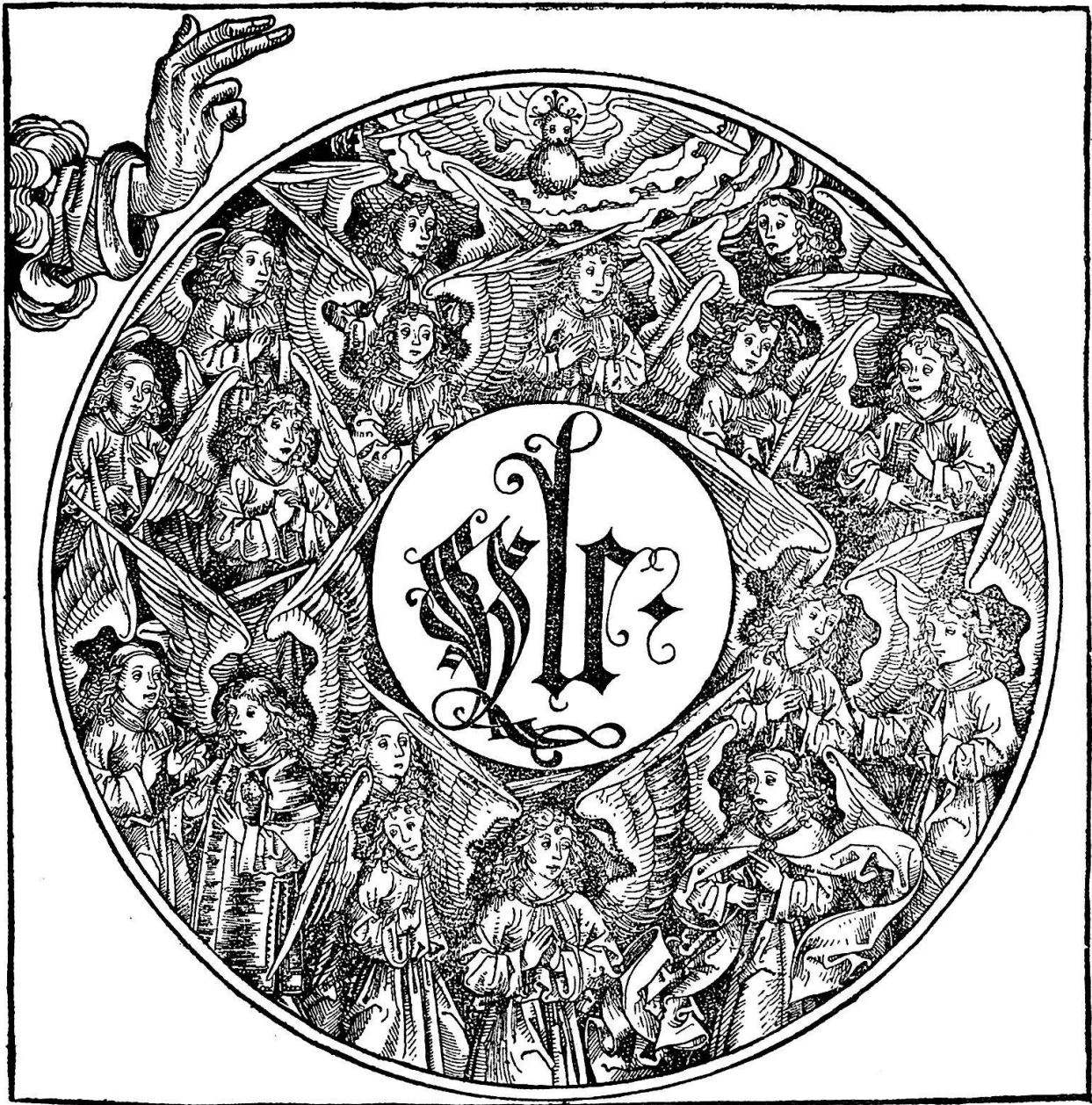
Abb. 2. Der Kreis der Engel