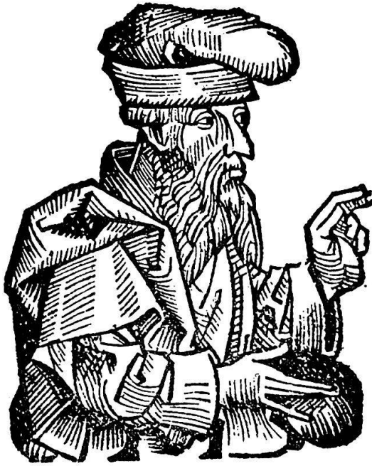
Abb. 7. Der Hohepriester Achimelech aus der Zeit Davids. Der gleiche Holzschnitt dient auch zur Wiedergabe verschiedener griechischer Philosophen und des jüngeren Scipio africanus