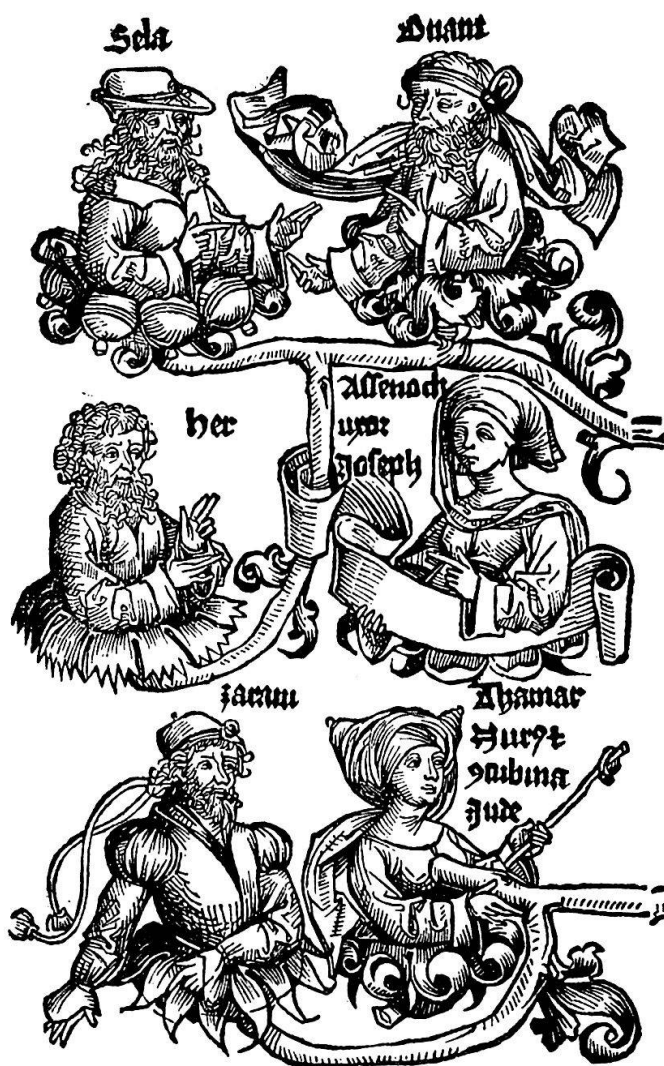
Abb. 5. Typischer Ausschnitt aus den alttestamentlichen Stammäbäumen

schen Vorstellung, der Papst als Stellvertreter Gottes habe es der deutschen Nation verliehen, verbunden, sondern das deutsche Imperium ist rechtmäßiges Erbe und weltgeschichtliche Fortsetzung der altrömischen Herrschaft. – Die zweite Hauptquelle Schedels ist der «Tractatus de ortu et auctoritate imperii Romani» des Aeneas Sil-