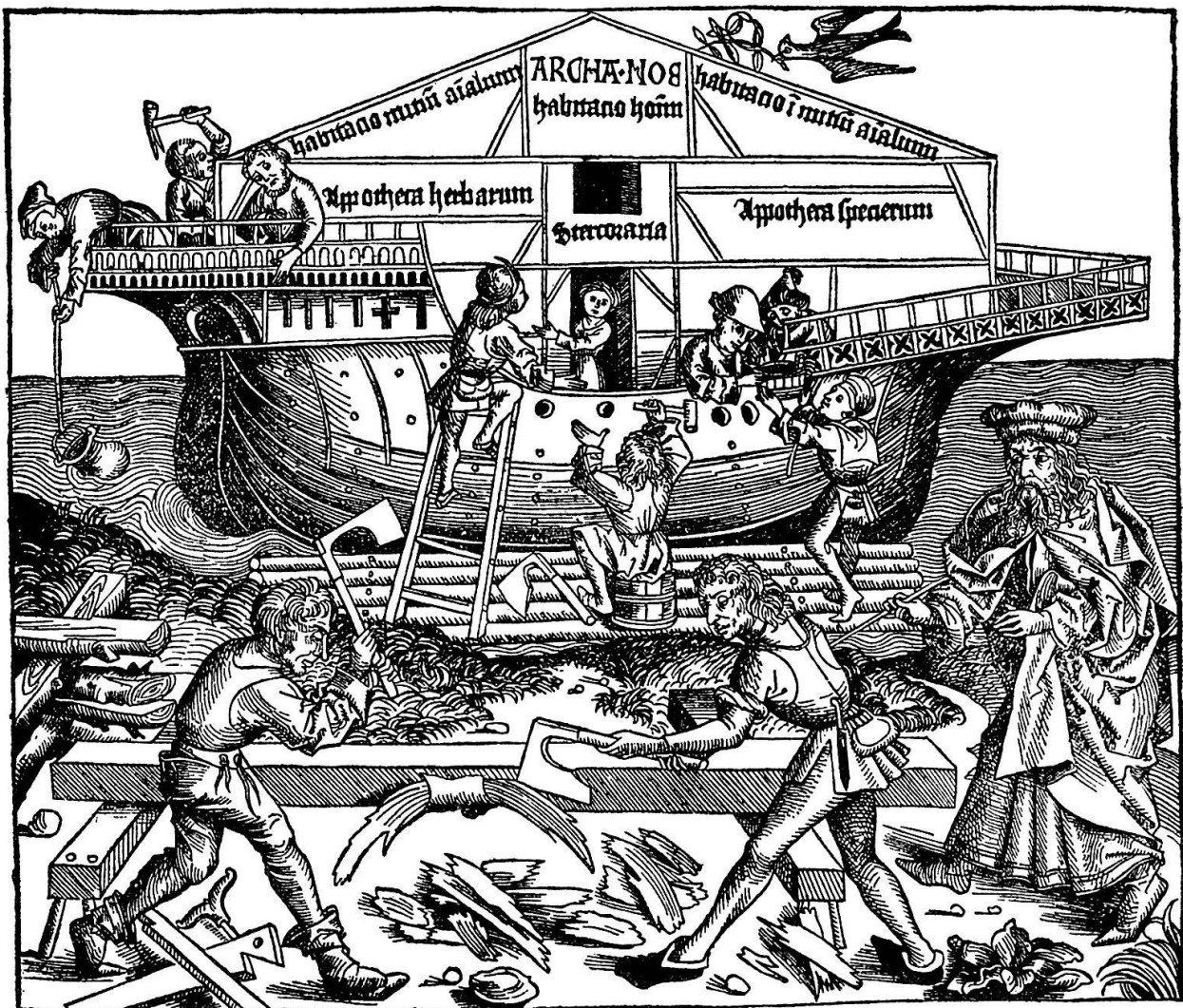
Abb. 4. Bau der Arche Noe