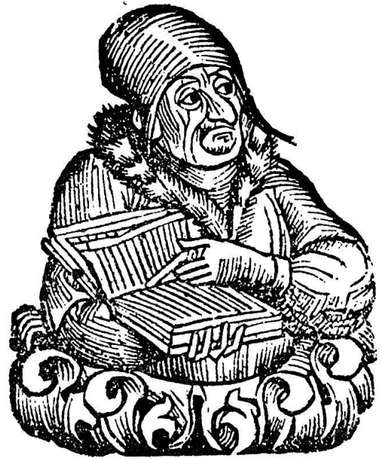
Abb. 8. Der Hohepriester Sadok. Er muß auch dem römischen Dichter Terenz, dann einer Anzahl Kirchenvätern und schließlich dem Zauberer Merlin, bekannt aus der bretonischen Artussage, Gestalt leihen