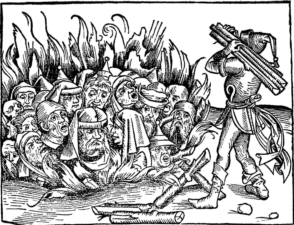
Abb. 17. Feuertod der Juden von Deggendorf in Niederbayern im Jahre 1337, die der Hostienschändung beschuldigt wurden. Das Bild wird zur Illustration ähnlicher Exzesse in Breslau, Passau und Regensburg weiterverwendet

wendet, so daß dieselben Illustrationen oft ein halbes Dutzend Mal wiederkehren.