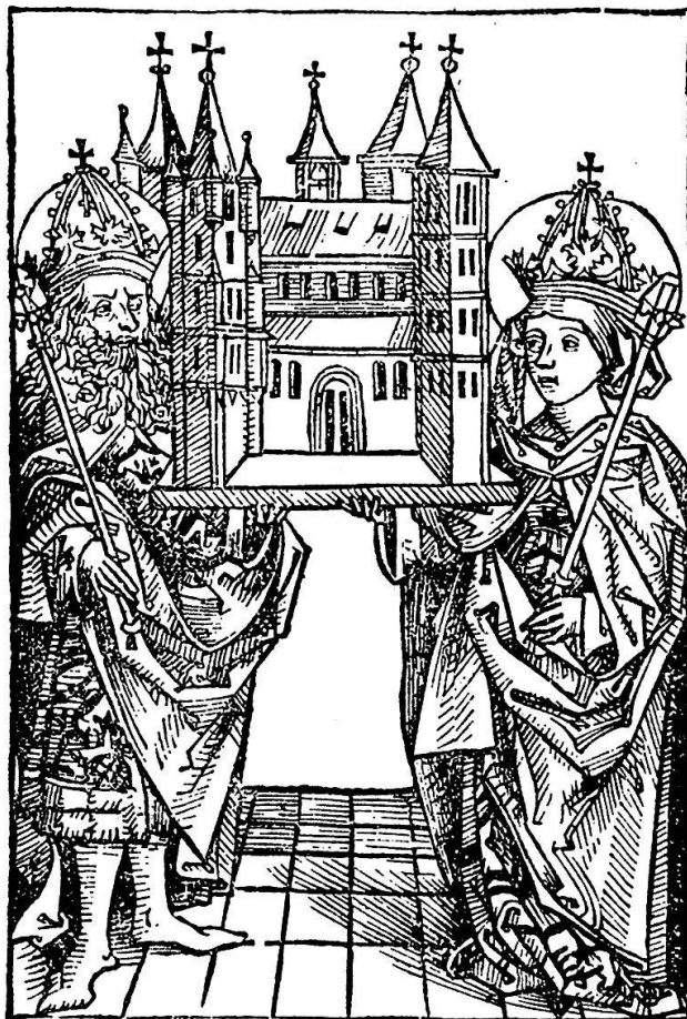
Abb. 12. Kaiser Heinrich II., der Heilige, mit seiner Gemahlin Kunigunde, die zusammen den Bamberger Dom stifteten, der später ihre Grabstätte wurde. Die um die Mitte des 13. Jahrhunderts geschaffenen Stifterfiguren zählen unter die auserlesensten Meisterwerke der gotischen Plastik in Deutschland

Drucktechnik hat begreiflicherweise die Fertigkeit im Formschneiden eine hohe Vollendung erreicht, so daß der «Riß» des Künstlers in der Vervielfältigung fast vorlagegetreu wiedergegeben wurde. (Wer sich eingehender mit diesen Problemen beschäftigen will, sei verwiesen auf