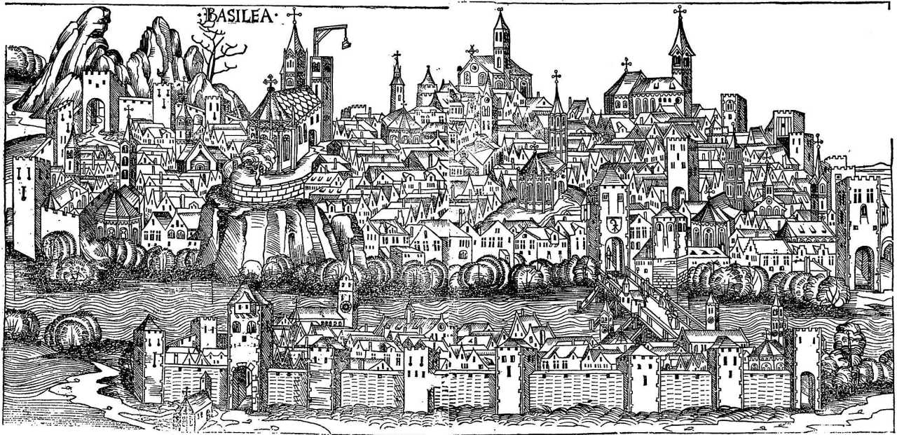
Abb. 19. Die Stadt Basel im 15. Jahrhundert. Im Gegensatz zu vielen andern Städtebildern kann dieses berühmte Blatt Anspruch auf eine optisch einigermaßen naturgetreue Darstellung machen