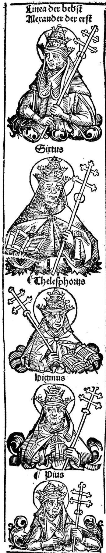
Abb. 15. Die römischen Kaiser und ihre deutschen Nachfolger sind, ebenso wie die römischen Päpste, in fortlaufenden Kolonnen ihrer historischen Reihenfolge nach im Bild festgehalten. Es handelt sich dabei um rein typisierende Figuren, die die Phantasie des Beschauers anregen, jedoch keine Porträtähnlichkeit vermitteln wollen